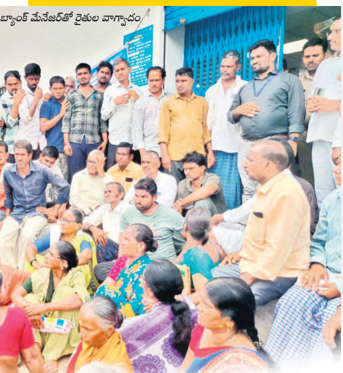
బ్యాంక్ మేనేజర్ తో రైతుల వాగ్వాదం

నిర్లక్ష్యం.. అధికారుల అలసత్వం, బ్యాంకర్ల నిర్లక్ష్యం కారణం గా వేలాది మంది రైతులకు రుణ మాఫీ కాలేదు. అ ర్థులైన అన్నదాతలకు మాఫీ కాకపోవడం వెనుక జా బితా రూపకల్పనలో తీవ్ర నిర్లక్ష్యం జరిగినట్లు రై తులు మండిపడుతున్నారు. మరోవైపు, రేపే కార్డు నిబంధన మూలంగా చాలా మందికి అన్యాయం జరిగినట్లు తెలిసింది. ఉమ్మడి కుటుంబాల నుంచి విడిపోయి వేరగా జీవనం సాగిస్తున్న వారికి మాఫీ కాలేదు. కుటుంబంలోని అందరికీ రుణమాఫీ పొందేందుకు అర్హత ఉన్నా ఒకరి పేరు ఉన్న రెంజిల్లోని కెనరా బ్యాంక్ ఎదుట ధర్మా చేప వడతో మిగతా వారికి అన్యాయం జరిగింది.