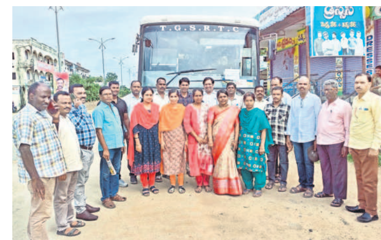
ఎల్లారెడ్డి నుంచి సీఎం సభకు తరలివెళ్తున్న ఉపాధ్యాయులు

ఫీక్ డెల్ సర్టిఫికేట్ ఫ్లాట్ రిజిస్ట్రేషన్ కామారెడ్డిలో వెలుగు చూసిన ఘటన ముగ్గురు నిందితుల అరెస్టు కామారెడ్డి రూరల్, ఆగస్టు 2: బతికున్న వ్యక్తి చనిపోయినట్లు ఫీక్ సర్టిఫికేట్ సృష్టించి దొంగతనంగా ఫ్లాట్ రిజిస్ట్రేషన్ చేసిన కేసులో కామారెడ్డి పోలీసులు.. ముగ్గురు నిందితులను అరెస్టు చేసి రిమాండ్ కు తరలించారు. పోలీసుల కడపం ప్రకారం.. కామారెడ్డి జిల్లా