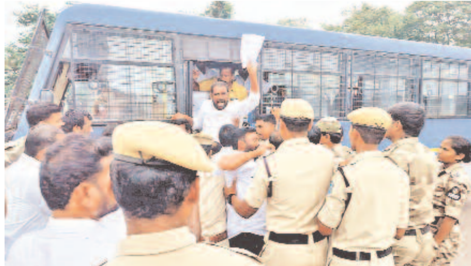
హైదరాబాద్ ట్యాంకంబండ్ వద్ద సెక్రటేరియట్ ముట్టడికి వెళ్తున్న మాజీ సర్పంచులను అడ్డుకుని అరెస్ట్ చేస్తున్న పోలీసులు

పంచాయతీల పెండింగ్ బిల్లుల కోసం చేపట్టిన నిరసనపై ఉక్కుపాదం