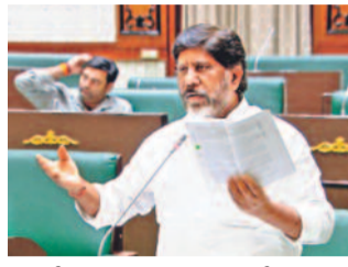
సభలో జాబ్ క్యాలెండర్ విడుదల చేస్తున్న భట్టి