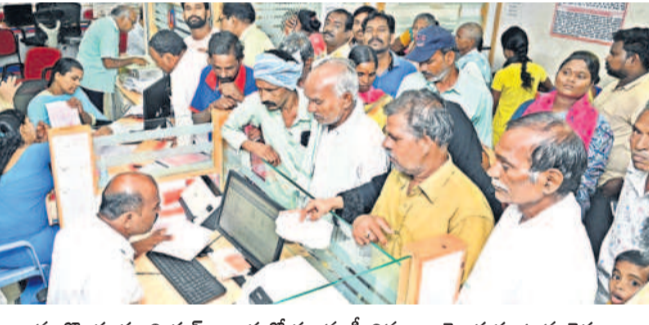
నల్లగొండ యూనియన్ బ్యాంకులో రుణమాఫీ వివరాలు తెలుసుకుంటున్న రైతులు

నల్లగొండ, ఆగస్టు 1 : అరకొర రైతు రుణమాఫీ అన్నదాతలను ఆగ్రహించి గురి చేస్తున్నది. ప్రతి రైతుకు రూ. రెండు లక్షల రుణం మాఫీ చేస్తామని రేవంత్ ప్రభుత్వం ప్రకటించగా వాస్తవంగా అందుకు విరుద్ధంగా ఉన్నది. జూలై 30న రెండో విడుదల రూ. 1.50 లక్షల రుణం మాఫీ చేస్తున్నట్లు చెప్పినా సగం మందికి మాఫీ కాలేదు. నల్లగొండ జిల్లా 83వేల మంది రైతులకు సంబంధించి రూ. 1014.68 కోట్లు మాఫీ అవుతుందని అధికారులు చెప్పగా బుధవారం నాటికి 49వేల మంది రూ. 503. 89 కోట్లు మాత్రమే జమ