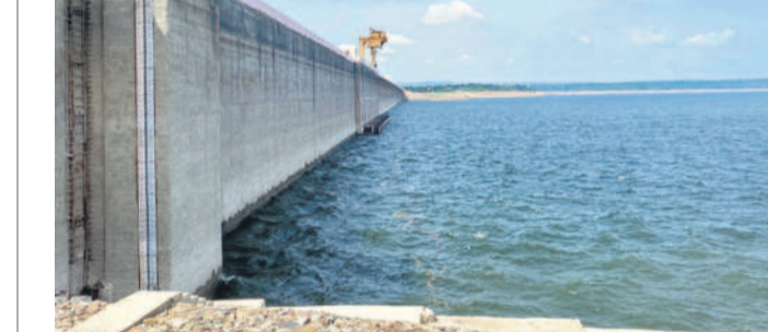
నల్లగొండ ప్రతినిధి, ఆగస్టు 1 (నమస్తే తెలంగాణ) : నాగార్జునసాగర్ రిజర్వాయర్ నుంచి ఎడమ కాల్వ ఆయకట్టుకు సాగునీటి విడుదల కోసం రంగం సిద్ధమైంది. ఎగువన విస్తారంగా తీసుకున్నప్పుడు వరద సాగర్ కు పోటెత్తుతున్నది. దాంతో రైతుల డిమాండ్ నేపథ్యంలో సాగర్ ఎడమ కాల్వకు సాగునీటిని విడుదల చేయాలని ప్రభుత్వం నిర్ణయించింది. శుక్రవారం సాయంత్రం 4 గంటలకు ఎడమకాల్వకు నీటి విడుదల చేయాలని తీసుకున్నా. భారీ నీటిపారుదల శాఖ మంత్రి ఎ.వై. ఉత్తమ్ కుమార్ రెడ్డితోపాటు కృష్ణా నాగేశ్వరరావు ప్రత్యేకంగా హెలికాప్టర్ మధ్య హృం 3.20 గంటలకు సాగర్ లోని బుద్ధవనానికి చేరుకుంటారు. ఆక్కడి నుంచి స్టానిం ఎం పీ, ఎమ్మెల్యేలతో కలిసి మం త్రులు 3.40 గంటలకు పార్టీవెళ్లి వద్ద ఉన్న ఎడమకాల్వ హెడ్ రిగ్యులేటర్ వద్దకు చేరుకుంటారు. సాయంత్రం 4 గంటలకు గోట్లను ఎత్తి ఎడమ కాల్వలోకి నీటిని విడుదల చేస్తారు. అనంతరం 4.20 గంటలకు సాగర్ డ్యామ్ వద్దకు చేరుకుని వరద ఉధృతిని పరీక్షించి విజయవిహారం చేరుకుంటారు. తిరిగి 5.30 గంటలకు బుద్ధవనంలోని హెలికాప్టర్ నుంచి హైదరాబాద్ కు తిరుగునది వారు.