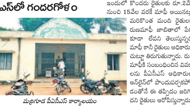
మల్లగూడ పీపీసీఎస్ కార్యాలయం

• మొదటి విడుదలలో 122కు 67 మందికి మాఫీ మల్లగూడ : మల్లగూడ పీపీసీఎస్ పరిధిలో 305మంది రైతులు రూ. 1.55 కోట్ల పంట రుణం తీసుకున్నారు. మొదటి విడుదలలో అక్షలోపు రుణం తీసుకున్న 122మంది రైతుల జాబితాను ప్రభుత్వం ప్రకటించగా 67 మందికి మాఫీ అయ్యింది.