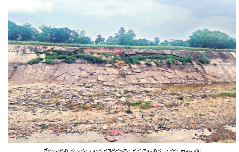
వేములపల్లి మండలం అన్నవరెడ్డిగూడెం వద్ద దెబ్బతిన్న ఎడమ కాల్వ కట్ట

కల్వ ప్రజలకు కంటి మీద కుసుకు లేకుండా పోయింది. దానితోపాటు మర్నాడు కారణంగా నీరందక వేల ఎకరాల్లో పంట నష్టం వాటిల్లింది. అధికారుల నిర్లక్ష్యంతోనే పరిస్థితి ఇంత తీవ్రంగా దాల్చిందని విమర్శలు వెల్లువెత్తాయి. ఇప్పటికీ అనేక చోట్ల ఎడమ కాల్వ కట్టలు బలహీనంగా ఉండడం అందోళన కలిగిస్తున్నది. వరాణాస పరిస్థితుల్లో ఇప్పటికే గత రెండు సీజన్లు ఆయకట్టుకు నీళ్లు రాలేదు. ఇప్పుడు వరుణుడి కరుణతో వరద పోటెత్తుండడంతో ఆశలు చిగురిస్తుండగా, కాల్వలు పరిస్థితి భయపెడుతున్నది.