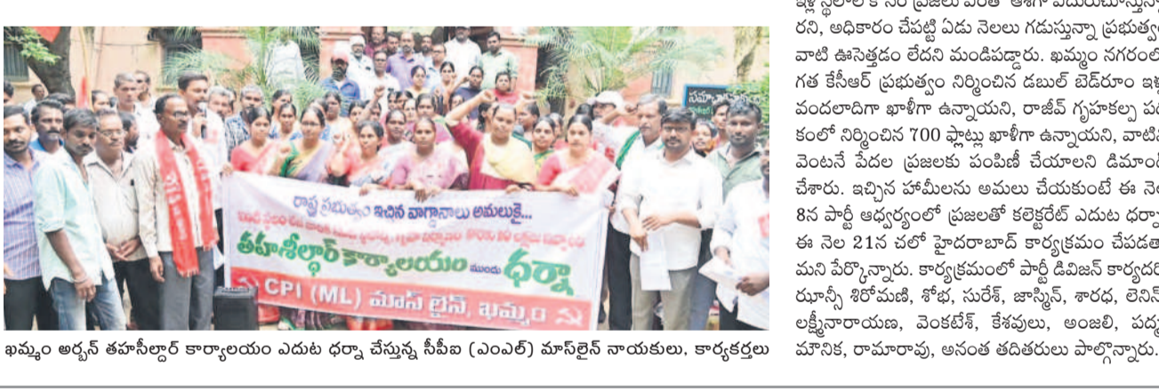
ఖమ్మం అధ్యక్ష తహసీల్దార్ కార్యాలయం ఎదుట ధర్మా చేస్తున్న సీపీఐ (ఎంఎల్) మూన్ లైన్ నాయకులు, కార్యకర్తలు