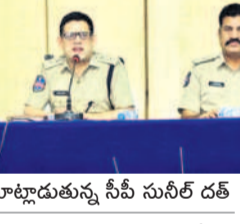
సమీక్షలో మాట్లాడుతున్న సీపీ సునీల్ దత్

రఘునాథపాలెం, ఆగస్టు 1: సైబర్ నేరాలపై బాధితులకు సహాయం పోగొట్టుకున్న బాధితులకు (గోల్డెన్ అవర్) గంట వ్యవధిలో 1930కి కార్ల చేయడం ద్వారా పోలీస్ అధికారిని మొత్తాన్ని స్తంభింపజేసి అవకాశం ఉంటుందని పోలీస్ కమిషనర్ సునీల్ దత్ అన్నారు. గురువారం పోలీస్