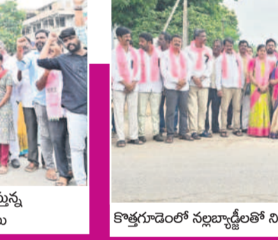
కొత్తగూడెంలో నల్లవాళ్లంతో నిరసన తెలుపుతున్న బీఆర్ఎస్ నేతలు