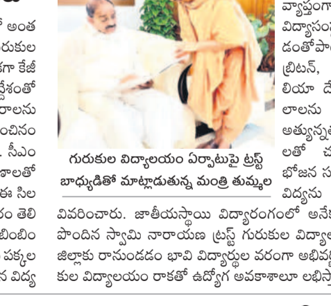
గురుకుల విద్యాలయం ఏర్పాటుపై ట్రస్ట్ బాధ్యుడితో మాట్లాడుతున్న మంత్రి తుమ్మల