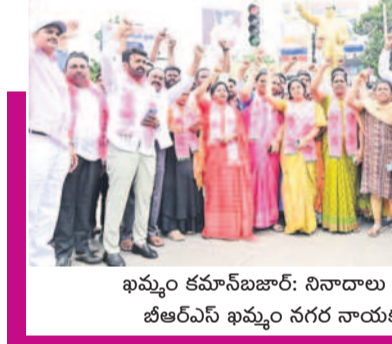
ఖమ్మం కమాన్ బజార్: నినాదాలు చేస్తున్న బీఆర్ఎస్ ఖమ్మం నగర నాయకులు