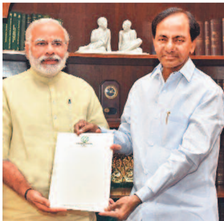
2016లో ప్రధానిని కలిసిన ఎన్సీ వర్గీకరణ సమస్యను పరిష్కరించాలని విన్నవించిన అప్పటి సీఎం కేసీఆర్

వర్గీకరణకు కేసీఆర్ బాసలు • పోరాటానికి ఆది నుంచి బీఆర్ఎస్ అండ్ >13 • రాష్ట్ర ఏర్పాటు వెంటనే అసెంబ్లీ ఏకీకరణ తీర్మానం • ఎన్సీ వర్గీకరణ కోరుతూ ప్రధాని కేసీఆర్ వినతి