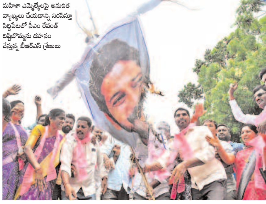
మహిళా ఎమ్మెల్యేలపై అనుచిత వ్యాఖ్యలు చేయడాన్ని నిరసిస్తూ సిద్దిపేటలో సీఎం రేవంత్ దిష్టిబొమ్మను దహనం చేస్తున్న బీఆర్ఎస్ శ్రేణులు

రాష్ట్రవ్యాప్తంగా సీఎం రేవంత్ దిష్టిబొమ్మల దహనం.. బీఆర్ఎస్ ఎమ్మెల్యేల ఆందోళనతో అట్టుడికిన అసెంబ్లీ మహిళా ఎమ్మెల్యేలకు మళ్లీ అవమానం.. నాలుగున్నర గంటలు నిలబడినా మాట్లాడేందుకు దక్కని అవకాశం క్షమాపణ చెప్పాలంటూ సీఎం చాంబర్ ముందు బైరాయింపు.. కేటీఆర్ సహా బీఆర్ఎస్ శాసనసభ్యుల అరిస్టెంట్