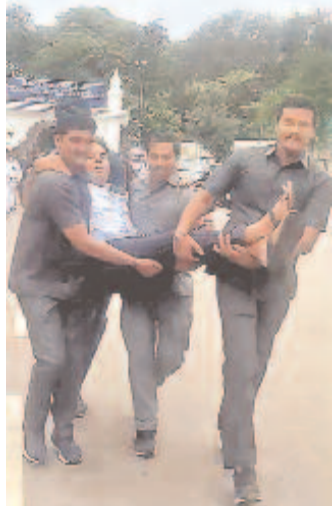
అసెంబ్లీలో నిరసన తెలుపుతున్న బీఆర్ఎస్ వర్గానికి ప్రతినిధిగా, ఎమ్మెల్యే కేటీఆర్ను సభ నుంచి బలవంతంగా బయటకు తీసుకెళ్లిన భద్రతా సిబ్బంది