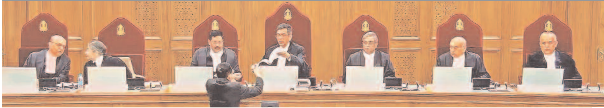
గురువారం ఎన్సీ వర్గీకరణపై తీర్మానం వెలువరిస్తున్న సుప్రీం కోర్టు ధర్మాసనం సభ్యులు వరుసగా జస్టిస్ మనోజ్ మిశ్రా, జస్టిస్ బేలా ఎం త్రివేది, జస్టిస్ బీఆర్ గవాయ్, సీజబి జస్టిస్ చంద్రచూడ్, జస్టిస్ విక్రమ్ నాథ్, జస్టిస్ పంకజ్ మిశ్రా, జస్టిస్ సతీశ్ చంద్ మిశ్రా

PUBLISHED FROM KARIMNAGAR • HYDERABAD • WARANGAL • KHAMMAM • NALGONDA • MAHABUBNAGAR • NIZAMABAD www.ntnews.com ntdailyonline