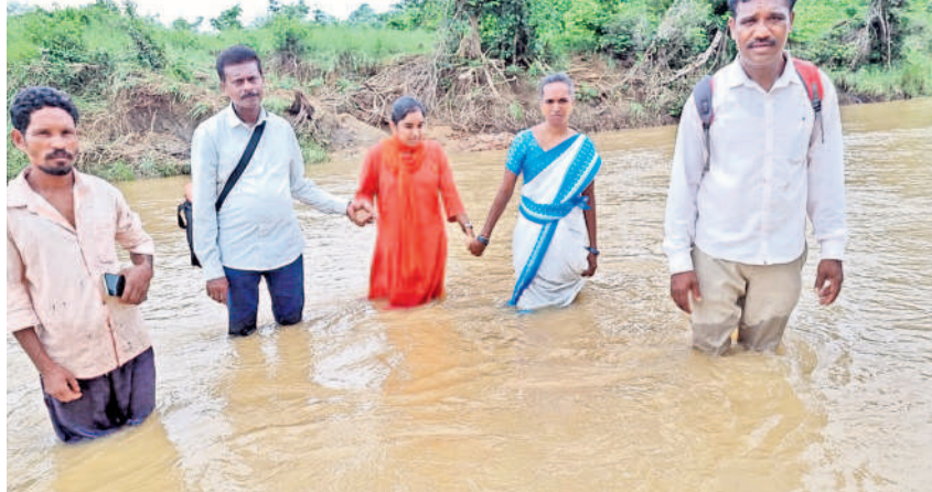
గొత్తకోయిలకు వైద్యం చేసేందుకు జూరూడు బండ వాగు దాటి వెళ్తున్న వైద్య సిబ్బంది

మూబాబాబాద్, జూలై 31: సమస్య తెలంగాణ: కుక్కలు, కోతులతో ప్రజలు చాలా ఇబ్బందులు పడుతున్నారని, వాటిని నియంత్రించేందుకు రాష్ట్ర ప్రభుత్వం ప్రత్యేక చర్యలు తీసుకోవాలని ఎమ్మెల్యే తక్కువ రవీందర్ రావు కోరారు. బుధవారం శాసనమండలిలో ఆయన ప్రసంగించారు. మూబాబాబాద్ జిల్లాలో ఇటీవల ఒక అల్పి, మరొకడో ఒక కొన్నెలలో కుక్కలు కుటుంబ గర్భ ఆ తర్వాత అనారోగ్యంతో మృతిచెందారని ఆయన గుర్తుచేశారు. కోతులను నియంత్రించేందుకు కుక్కలను వెంటితే ఆ రెండూ కలిసి పోయి ప్రజలపై దాడులకు తెగబడుతున్నాయని వివరించారు. అలాగే వాటి బెడదతో రైతులు వేరు శనగ, కూరగాయలు, పండ్ల తోటలు వేరువేరు మాసాకారం చేస్తోన్నారని, లోట్ల మీద ప్రజలు నడ వాలంటీస్ భయపడుతున్నారని తెలిపారు. ఇప్పటికైనా రాష్ట్ర ప్రభుత్వం వెంటనే కుక్కలు, కోతులను నియంత్రించి ప్రజల ప్రాణాలను కాపాడాలని సభ దృష్టికి తీసుకున్నారు.