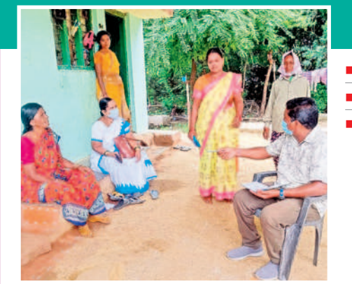
జ్వరంతో బాధపడుతున్న రోగులకు వైద్య సిబ్బంది

- నర్సింహలపేట/పటూరునాగారం/కమలాపూర్, జూలై 31