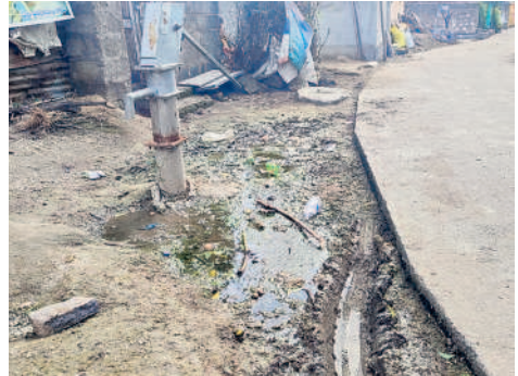
నర్సింహలపేట: రోడ్డుపై నిలిచిన బురద నీరు

- నర్సింహలపేట/పటూరునాగారం/కమలాపూర్, జూలై 31