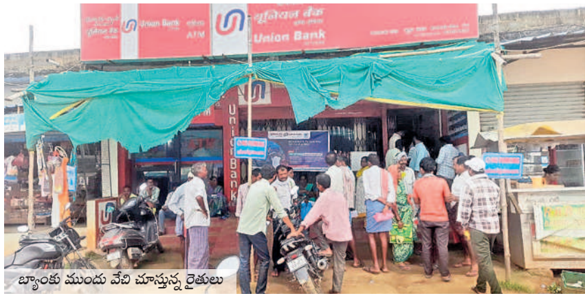
బ్యాంకు ముందు వేలి చూస్తున్న రైతులు