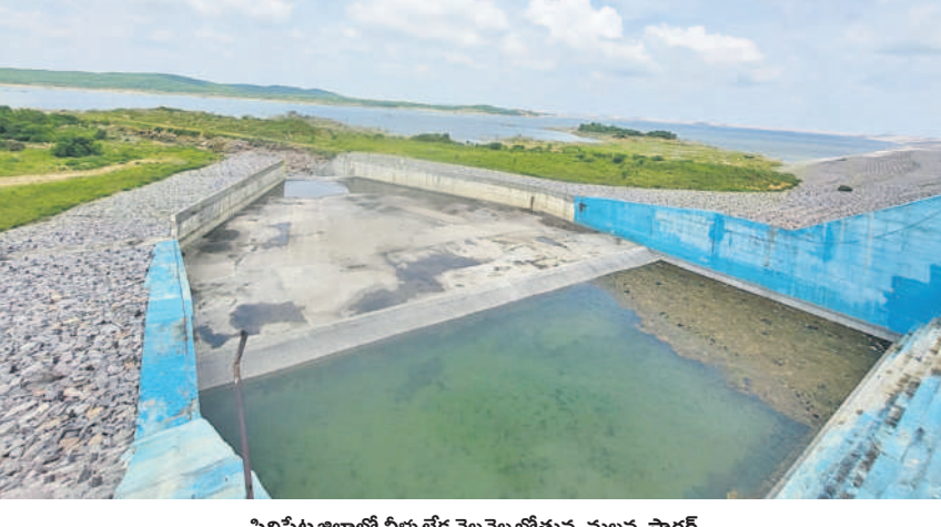
సిద్దిపేట జిల్లాలో నీళ్లు లేక వెలవెలబోతున్న మల్లన్న సాగర్

కొండపాక(కుకునూరుపల్లి), జూలై 31 : దేవూరు ఎత్తిపోతల పథకంలో భాగంగా సిద్దిపేట జిల్లా కొండపాక మండలం ఐనాపూర్ శివారులో తపాలా సంస్థ రిజర్వాయర్ నిర్మించారు. కొండపాక మండలంలోని పలు గ్రామాల్లో సాగునీరు అందించి సస్యశ్యామలం చేయాలని సంకల్పించిన తెలంగాణ తొలి సీఎం కల్వకుంట్ల చంద్రశేఖరరావు కొండపాక మండలంలోని 11వేల ఎకరాలకు సాగునీరు అందించే లక్ష్యంగా సమాచార రూ.50 కోట్లు ఖర్చుచేసి డీ4కెనాల్ ఏర్పాటు చేయించారు. కొండపాక మండల కేంద్రంలో పాటు మండలంలోని తిమ్మాకొండపల్లి, సిరిసిగండ్ల, గియా గా