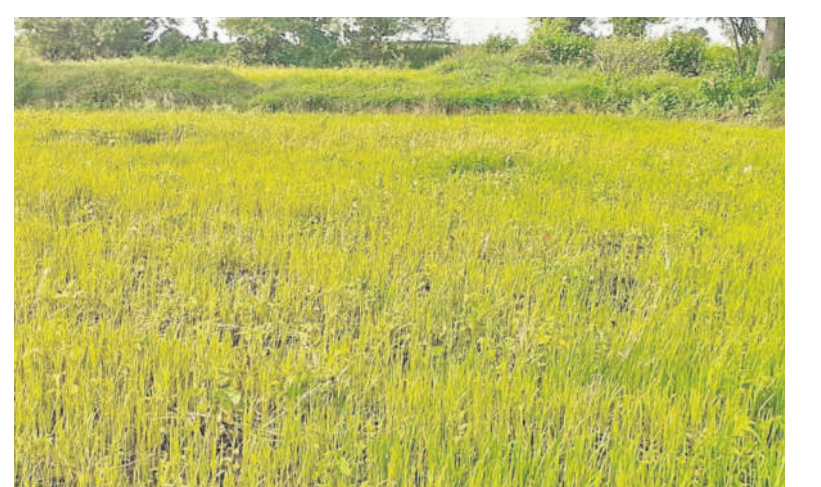
సిద్దిపేట జిల్లా చంద్రాపూర్లో రంగనాయకసాగర్ ఎడమ కాలువ కింద నీళ్లు లేక బీడు పెట్టిన పొంది

I హైదరాబాద్, గురువారం 1 ఆగస్టు 2024 SIDDIPET