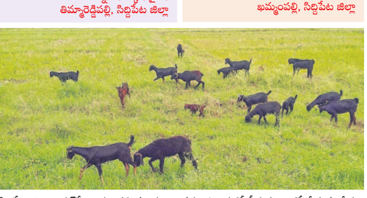
సిద్దిపేట జిల్లా అక్కర్పేట-భూంపల్లి మండలం ఎన్నగల్ శివారులో బీడు పొలంలో మేపన్న మేకలు

కొండపాక(కుకునూరుపల్లి), జూలై 31: వ్యవసాయాన్ని మరంత ముందుకు తీసుకెళ్లాలి ప్రభుత్వం సాగునీటిని అందించకుండా మొద్దునంద పోతున్నది. కేసీఆర్ ముఖ్యమంత్రి గా ఉన్నప్పుడు డీ4 కెనాల్ ద్వారా కొండపాక మండలంలోని అనేక గ్రామాలకు సాగునీరు అందించింది. ఎండాకాలంలో కూడా చెరువులు ముత్యం పోతాయి. గిచ్చుడు వాసకాలంలో కూడా చెరువులో నీళ్లు లేవు. రైతుల కష్టాలను దృష్టిలో పెట్టుకొని డీ4 కెనాల్ ద్వారా సాగునీరు అందించి రైతాంగాన్ని ఆదుకోవాలి.