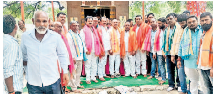
తెలంగాణ డాక్టర్ బీఆర్ అంబేద్కర్ సంఘం నాగోల్ సూతన కార్యచక్రస్థాయి

హయత్ నగర్ సర్కిల్ కార్యాలయంలో మాడు సర్కిల్ అధికారులతో డోమల నివారణ కోసం నిర్వహించిన సమన్వయ కమిటీ సమావేశం పాల్గొన్న ఉప కమిషనర్లు, అధికారులు