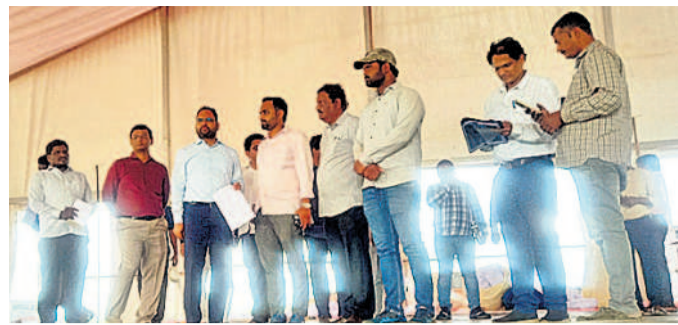
విద్యా పరిశోధన కమిటీ సమావేశం