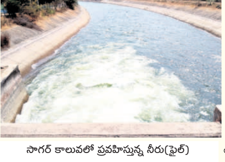
సాగర్ కాలువలో ప్రవహిస్తున్న నీరు (ఫైల్)

బాటిగా వరద నీరు వచ్చి చేరుతోంది. నీటిని దిగువకు వదలడంతో వేగంగా సాగర్ జలాశయానికి 1.79 లక్షల క్యూసెక్కుల నీరు వచ్చి చేరుతుండడంతో మరో నాలుగు రోజుల్లో సాగర్ డ్యాం నిండనున్నది. అయితే జిల్లాలోని పాలేరు రిజర్వాయర్ కింద 2.5 లక్షల ఎకరాల్లో రైతులు వరి సాగు చేయనుండగా.. రోజుల్లో పాలేరు నుంచి నీటిని విడుదల చేయనున్నారు. అంతేకాక సాగర్ ఆయకట్టు పరిధిలోని చెరువులన్నింటినీ నింపాలని రైతులు కోరుతున్నారు. గత ఏడాది నీటి కొరతతో పూర్తిస్థాయిలో రైతులు పంటలు మేనుకోలేకపోయారు. వేసిన పంటలు సైతం నీరందక ఎండిపోయాయి. రైతులు తీవ్రంగా స్పృహించారు. ఈసారి కూడా అదే పరిస్థితి ఉన్న నేపథ్యంలో ఎగువన కురుస్తున్న వర్షాలతో శ్రీశైలం ప్రాజెక్టు వరద నీరు పోలికతో ఉంది. దీంతో కృష్ణా ఆయకట్టు రైతుల్లో ఆశలు చిగురువిప్పుతున్నాయి. సాగర్ నీటి విడుదలపై ప్రణాళిక వాసకాలం పంటలు సాగుకు నీరు ఇవ్వాలనే ఆలోచనతో అధికారులు యుద్ధప్రాతిపదికన నీటి విడుదల ప్రణాళికను రూపొందిస్తున్నారు. పాలేరు నుంచి కల్వార వరకు సాగర్ ఎడమ కాలువ రెండో జోన్ కింద సుమారు 2.5 లక్షల ఎకరాల్లో వరి సాగు చేయనుండగా.. ఆయకట్టు రైతులకు నీటి విడుదలతో తీవ్ర కలుగుతుంది అనిపిస్తుంది.