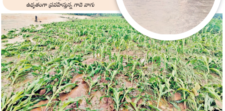
కొత్తగూడ : కొత్తపల్లి శివారులో ఉద్యతంగా ప్రవహిస్తున్న గాదె వాగు