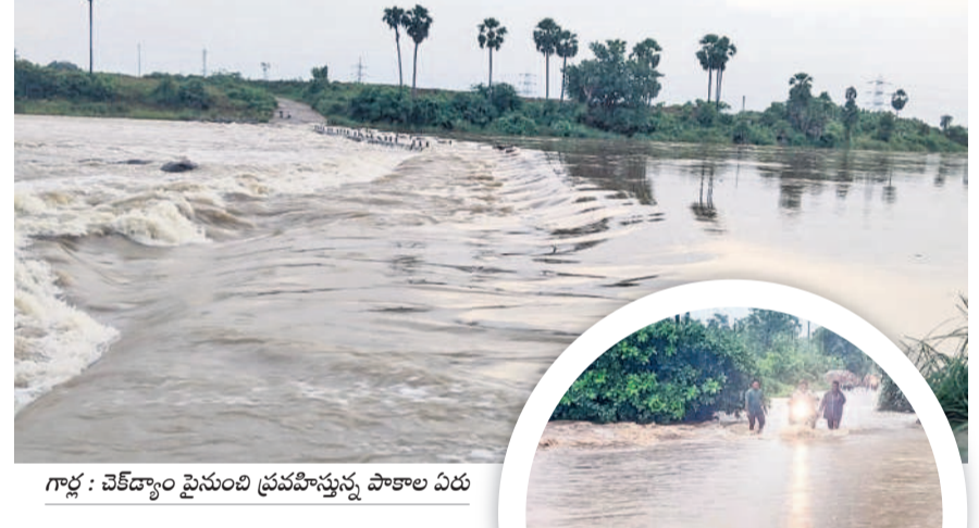
గార్ల : చెట్లద్యాం పైనుంచి ప్రవహిస్తున్న పాకాల ఏరు