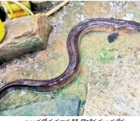
ఇల్లందలో మత్స్యకారుడికి దొరికిన మలుగుబేను

చుట్టూ వచ్చని పాలాలతో ఉన్న ఈ గుట్టలను మేఘాలు ఆవిరించిన దృశ్యాలు చూపరులను అచ్చెరువొందిస్తున్నాయి. మంగళవారం ఉదయం చిరు జల్లులు తుంపర వలే కురుస్తున్న వేళ వచ్చని గుట్ట వద్ద ప్రకృతి రమణీయ చిత్రం ఆవిష్కృతమైంది. ఇది అద్భుతం బయ్యారం మండలంలోని ఏజెన్సీ గ్రామంలోని పెద్దగుట్ట వద్ద కనిపించింది. - బయ్యారం, జూలై 30