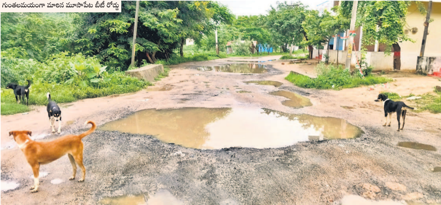
గుంతలమయంగా మారిన మూసాపేట బీటీ రోడ్డు