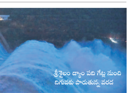
శ్రీశైలం డ్యాం పది గేట్లు నుంచి దిగువకు పారుతున్న వరద

మరికల్, జూలై 30 : సమస్తే తెలంగాణ దినపుత్సవంలో ఈ నెల 29న ప్రచురించిన 'నామస్తే తెలంగాణ' నేడు వెలువార కు నీటిపారుదల శాఖ అధికారులు స్పందించారు. తీలేరు స్టేజీ-2 నుంచి మంగళవారం కోయిల్ సాగర్ కు పంపింగ్ను ప్రారంభించారు. గతంలో జూరాలకు వరదలు వచ్చాయంటే పంచాయితీ నుంచి కోయిల్ సాగర్ కు నీటిని విడుదల చేసేవారు. ప్రస్తుతం జూరాల గేట్లు ఎత్తివేస్తే కోయిల్ సాగర్ కు నీటిని ఒక్క రోజు విడుదల చేసే పంపులు బండ్ల చేశారు. దీంతో ప్రాజెక్టుకు నీరు చేరుతుండగా లేదా అని రైతులతో ఆందోళన మొదలైంది. ఈ క్రమంలో నీటిని విడుదల చేయడంతో రైతులు హర్షం వ్యక్తం చేస్తున్నారు.