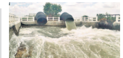
తీలేరు పంచాయితీ నుంచి వరగులు పెడుతున్న వరద

కాంగ్రెస్ సర్కారు కొలుపుదీలి ఎనిమిది నెలలు అప్పుతున్నా ఉమ్మడి జిల్లాలో మంత్రి, ఎమ్మెల్యేలు రహదారుల మరమ్మత్తులను పట్టించుకోవడం లేదని విమర్శలు వస్తున్నాయి. ఉమ్మడి జిల్లాలో ఉన్న పల్లెలకు జూరాల వైపు వచ్చే మంత్రి, ఎమ్మెల్యేలు కూడా వారి నియోజకవర్గాల్లో అప్రవృత్తంగా మారిన రోడ్లను పట్టించుకోవడమే లేదని ఆరోపణలు ఉన్నాయి. మరోవైపు 6 గార్డెన్ లోను అమలు చేయకపోవడం.. రైతు సేవ, రుణమాఫీ అర్హులకు ఇవ్వకపోవడంతో మంత్రిలు, ఎమ్మెల్యేలు గ్రామల్లో తిరుగులేక పోతున్నారు. ఇటీవల ముఖ్యమంత్రి రేవంత్ రెడ్డి సొంత జిల్లాలో పర్యటించే ఛాదామిడి చేశారే తప్ప.. రోడ్ల కోసం నయన పైనే విడిచలేదు.