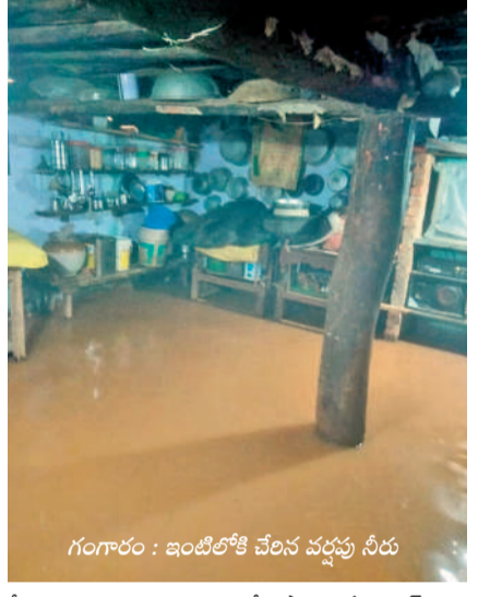
గంగారం : ఇంటిలోకి చేరిన వర్షపు నీరు