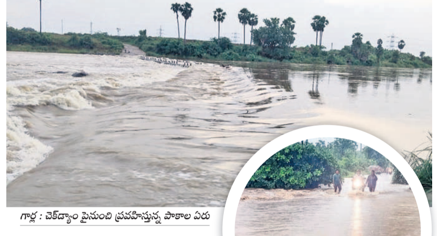
గార్ల : చెట్లెక్కిన ప్రవహిస్తున్న పాకాల ఏరు