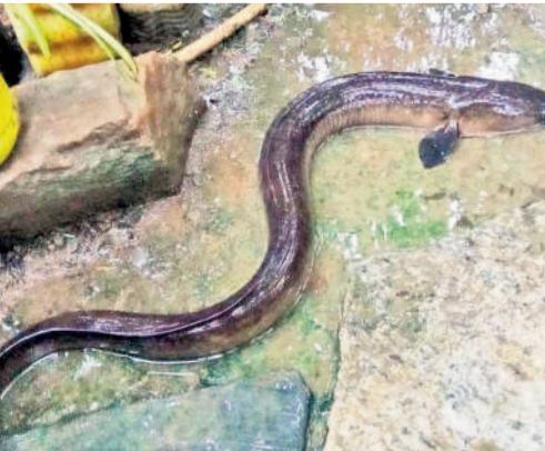
ఇల్లండులో మత్తకారుడికి దొరికిన ములుగుబేను

ఆకేరు వాగులో అరుదైన చేప వర్షపునీటి, జూలై 30 : ఆకేరు వాగు ఇల్లండు గ్రామానికి చెందిన మత్తకారుడి వలకు మంగళవారం అరుదైన చేప చిక్కింది. కొర్రమీను ఆకారంలో ఉండి పాములా పొడవుగా ఉండడంతో ఆశ్చర్యానికి గురయ్యాడు. చేపను ఇంటికి తీసుకెళ్లగా పలువురు ఆసక్తిగా పరిశీలించారు. దీనిని కొర్రమీను జాతికి చెందిన ములుగుబేను అంటారు మత్తకారులు చెబుతున్నారు.