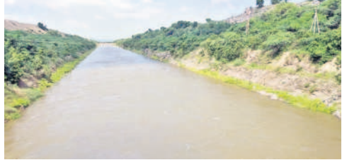
బోయినపల్లి: వరద కాలువ ద్వారా ఎస్సారా జలాలు నీటి తరలుతున్న కాశ్వరం జలాలు

ఎగిసి పడి నంది రిజర్వాయర్లోకి చేరుతున్నాయి. అక్కడ రిజర్వాయర్ గేట్లను ఎత్తడంతో అంతే మొత్తంలో జలాలు అందడం టన్నె క్లలో గ్రావిటీ ద్వారా కరీంనగర్ జిల్లా రామడుగు మండలం లక్ష్మీపూర్లోని గాయత్రీ పంపహౌస్ కు చేరుకుంటున్నాయి. అక్కడ సైతం నిన్నామొన్నటికే నాలుగు బాహులు మోటర్ల ద్వారా ఎత్తిపోతలు కొనసాగించిన అధికారులు, సోమవారం ఐదో మోటర్ ను ఆన్ చేశారు. మొత్తంగా 15,750 క్యూసెక్కులు లిఫ్ట్ చేస్తుండగా, డెలివరీ సిస్టర్ను ద్వారా ఎగిసి పడ్డ జలాలు సుమారు 5.7 కిలో మీటర్లు ఉన్న గ్రావిటీ కాలువ ద్వారా వరదకాలువకు చేరుకొని అక్కడి నుంచి మధ్యమానేరుకు పరుగుడుతున్నాయి. సోమవారం సాయంత్రానికి రెండున్నర టీఎంసీలు జలాలు మధ్యమానేరుకు తరలింపట్టు ప్రాజెక్టు అధికారి రాంప్రదీప్ తెలిపారు. ఇన్ఫోను బట్టి అప్పటివేళే కొనసాగుతుందని వివరించారు. మధ్యమానేరు పూర్తి నీటి సామర్థ్యం 27.054 టీఎంసీలు కాగా, ప్రస్తుతం 7.491 టీఎంసీలు చేరుతుంది. ఎత్తిపోత ద్వారా పెద్ద ఎత్తున వరద వచ్చి చేరుతున్న నేపథ్యంలో మధ్యమానేరులో నీటి మట్టం గలం గంటకూ పెరుగుతోంది.