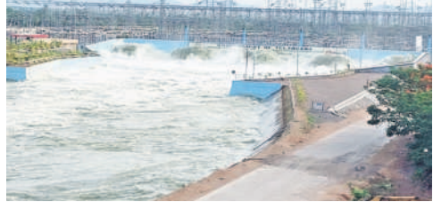
రామడుగు: గాయత్రీ పంపహౌస్ డెలివరీ సిస్టర్ను సుంచి ఎగిసిపడుతున్న కాశ్వరం జలాలు