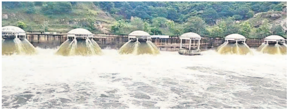
ధర్మారం: నంది పంపహౌస్ డెలివరీ సిస్టర్ను సుంచి ఉపాంగతున్న కాశ్వరం జలాలు