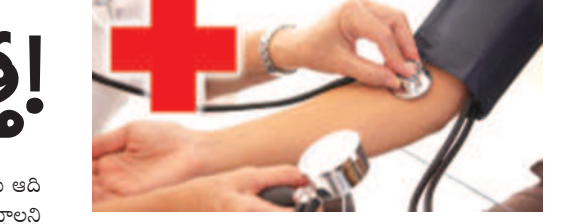
ఈ జాగ్రత్తలు తప్పనిసరి..

విద్యానగర్ జూలై 29.. ఎడతెలిపిలేని వర్షాలతో పరిసరాల్లో పరిశుభ్రత లోపించడం, తాగునీరు కలుషితం కావడం వల్ల వివిధ రకాల వ్యాధులు సంక్రమించే ప్రమాదం ఉన్నది. సీజనల్ వ్యాధులకు విషయంలో పూర్తి ఆప్రమత్తంగా ఉండాలని వైద్య ఆరోగ్య శాఖాధికారులు సూచిస్తున్నారు. అందులో భాగంగా అన్ని పాఠశాలలు, వసతి గృహాలు, ప్రభుత్వ కళ్యాణాలయాల్లో ప్రతి శుభ్రతలకు డైరీ అమలు చేయాలని సూచించేస్తున్నారు. పారిశుభ్యం ప్రత్యేక దృష్టి సారించాలని, డైరీ జీల శుభ్రత, దోహతు నియంత్రణ చర్యలు చేపట్టాలని ఎప్పటికప్పుడు సిబ్బందిని ఆదేశిస్తున్నారు. ఉష్ణుడి జిల్లా వ్యాప్తంగా రోజురోజుకూ డెంగ్యూ కేసులు పదులు సంఖ్యలో వస్తుండడంతో యాంటీ లార్వా కార్యక్రమాలు చేపట్టాలని ప్రభుత్వం అధికారులు, సిబ్బందికి సూచనలు చేసినది. నీరు నిల్వ ఉండకుండా చర్యలు తీసుకోవాలని ఆదేశించింది.