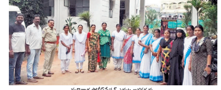
మట్టివాడ పోలీస్ స్టేషన్ ఎదుట ఆశవర్ష