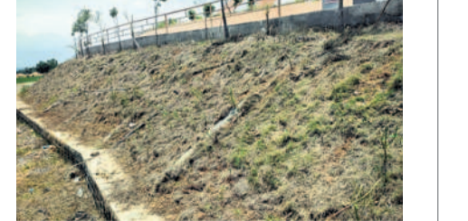
గడ్డి, మొక్కలను బర్రెలు మేయడంతో కళావిహారంగా ఆవరణ

లోని సోమేశ్వర ఆశ్రమంను అలయ సమీపంలో సుమారు రూ. 2 కోట్లతో సోమనాథ స్మృతివనాన్ని అతి సుందరంగా నిర్మించింది. అయితే నిర్వహణ లేమిటో స్మృతివనం అంతా బర్రె వేడతో కంపుకొడుతున్నది. కొందరు రోజూ అక్కడ బర్రెలను కట్టిస్తుండడంతో అవి ముక్కలు, పచ్చని గడ్డిని తినిపెట్టడం వల్ల పట్టణం వరకు లేదని స్థానికులు ఆగ్రహం వ్యక్తం చేస్తున్నారు. ఆహారం కలిగి ఉన్న వాహనం కోకకలాడిన ఈ పర్యాటక ప్రదేశాన్ని పరిరక్షించాలని సాహితీప్రియులు కోరుతున్నారు.