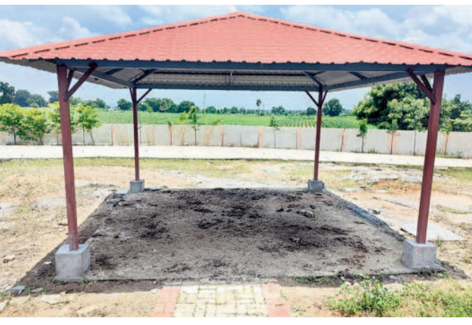
వేడతో అధ్వానంగా సోమనాథ స్మృతివనం