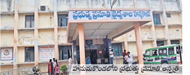
హనుమకొండలోని ప్రభుత్వ ప్రసూతి ఆస్పత్రి

ఈ దవాఖానం నుంచి బదిలీపై వెళ్లిన వారు ఎంతమంది? పనిచేస్తున్నది ఎవరు? అన్న సమాచారమేలేదు. రూ. లక్షల జీతాలు తీసుకుంటున్నప్పటికీ విద్యలో నిద్రకల్పం వహిస్తూ తమ సొంత ఆస్పత్రిలకు ప్రాధాన్యమిస్తున్నారు. ఈ నెపథ్యంలో ప్రభుత్వం ఆస్పత్రిలో బయోమెట్రిక్ హాజరు విధానాన్ని అమలు చేస్తున్నది. క్యాట్ చేసే డాక్టర్లు ఉదయం 9, సాయంత్రం 4 గంటలకు బయోమెట్రిక్ విధానంలో హాజరు నమోదు చేయాలి ఉంటుంది. దీని ఆధారంగానే డాక్టర్లకు వేతనాలు చెల్లిస్తారు. అయితే ఈ విధానం సైతం గందరగోళంగా ఉన్నట్లు తెలుస్తున్నది. ఇందులోనూ పలు అవకాశాలకు జరుగుతున్నాయనే ఆరోపణలు వెల్లడవుతున్నాయి. ఇక నవజాత శిశువులకు వైద్య సేవలందించే పిల్లల వార్డులో ముగ్గురు నుంచి నలుగురు డాక్టర్లు పిల్లల వారిగా విధులు నిర్వహించాలి