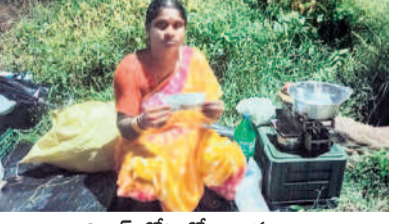
చిల్డ్రన్ నోటుతో బురిడీ

లోని సోమేశ్వర ఆశ్రమంను అలయ సమీపంలో సుమారు రూ. 2 కోట్లతో సోమనాథ స్మృతివనాన్ని అతి సుందరంగా నిర్మించింది. అయితే నిర్వహణ లేమిటో స్మృతివనం అంతా బర్రె వేడతో కంపుకొడుతున్నది. కొందరు రోజూ అక్కడ బర్రెలను కట్టిస్తుండడంతో అవి ముక్కలు, పచ్చని గడ్డిని తినిపెట్టడం వల్ల పట్టణం వరకు లేదని స్థానికులు ఆగ్రహం వ్యక్తం చేస్తున్నారు. ఆహారం కలిగి ఉన్న వాహనం కోకకలాడిన ఈ పర్యాటక ప్రదేశాన్ని పరిరక్షించాలని సాహితీప్రియులు కోరుతున్నారు.