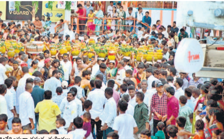
అంజనేయస్వామి ఆలయం నుంచి బోనాలలో ఊరేగింపుగా వస్తున్న మహిళలు