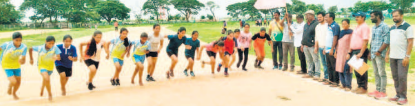
పరుగు పందెం పోటీలను ప్రారంభిస్తున్న అడ్డెట్లక్వి అసోసియేషన్ సంయుక్త కార్యదర్శులు

మన్యూనూల్ లో విద్యార్థులతో కలిసి అటవీ, పోలీస్ సిబ్బంది ర్యాలీ మన్యూనూల్ లో ఇంటరాక్టివ్ సెషన్ నిర్వహణ అవ్వూబాద్, జూలై 29 : అంతర్జాతీయ పులుల దినోత్సవాన్ని సోమవారం ఘనంగా నిర్వహించారు. మన్యూనూల్ లోని పర్యావరణ కేంద్రంలో విద్యార్థులకు 'ప్రకృతి పరిరక్షణలో పులుల ప్రాముఖ్యత' పై ఇంటరాక్టివ్ సెషన్ నిర్వహించారు. అంతకుముందు అవ్వూబాద్ టైగర్ రిజర్వ్ పరిధిలోని డోమలపెంబ, అవ్వూబాద్ లో మన్యూనూల్ అటవీ, పోలీస్ సిబ్బంది విద్యార్థులతో కలిసి ర్యాలీ నిర్వహించారు. పర్యావరణ, అడవులు, ప్లాస్టిక్ వాడకంతో కలి