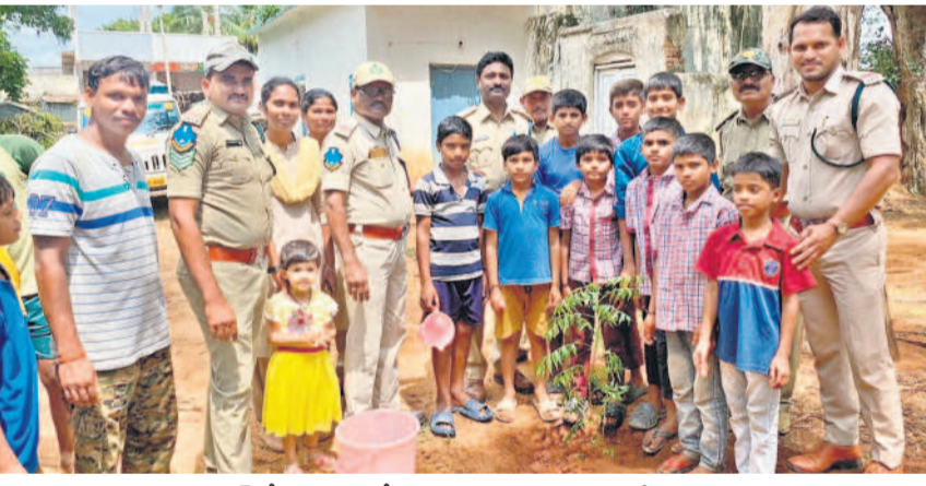
అవ్వూబాద్ లో విద్యార్థులతో కలిసి మొక్క నాటుతున్న అటవీ శాఖ సిబ్బంది

అక్కరూరు, జూలై 29 : దిగువ జూరాల జలవిద్యుత్ కేంద్రంలో మూడు రోజులుగా విద్యుదుత్పత్తి నిలిచిపోయింది. ఎగువ నుంచి వస్తున్న భారీ వరద కారణంగా పవర్ ప్రాజెక్టు యంత్రాలకు ముప్పు వాటిల్లి ప్రమాదమున్న పరిస్థితుల్లో విద్యుదుత్పత్తి నిలిపివేస్తున్నట్లు అధికారులు వెల్లడించారు. ఇదిలా ఉండగా ఎగువ జూరాలలో విద్యుదుత్పత్తి నిర్వహణగా కొనసాగుతుంది. ఐదు యూనిట్లలో విద్యుదుత్పత్తి జరుగుతుండగా ఆదివారం అల్లరాత్రి వరకు 2.93 మి.యూ ఉత్పత్తి కాగా ఇప్పటివరకు మొత్తం 31.318 మి.యూ ఉత్పత్తి జరిగింది. దిగువ జూరాలలో మూడు రోజుల కిందటి విద్యుదుత్పత్తి జరుగగా అప్పటి వరకు 32.995 మి.యూ ఉత్పత్తి జరిగింది. సోమవారం జూరాలకు 3.18 లక్షల క్యూసెక్కుల ఇన్ ఫ్లో కొనసాగడంతో దిగువ జూరాలలో విద్యుదుత్పత్తికి అవకాశం లేకుండా పోయిందని ఎన్ఈ కల్లూరి సుబ్బారామిరెడ్డి తెలిపారు. 2లక్షల క్యూసెక్కుల దిగువకు ఇన్ ఫ్లో ఉంటే దిగువ జూరాలలో విద్యుదుత్పత్తి నిర్వహించగలమని స్పష్టంచేశారు.