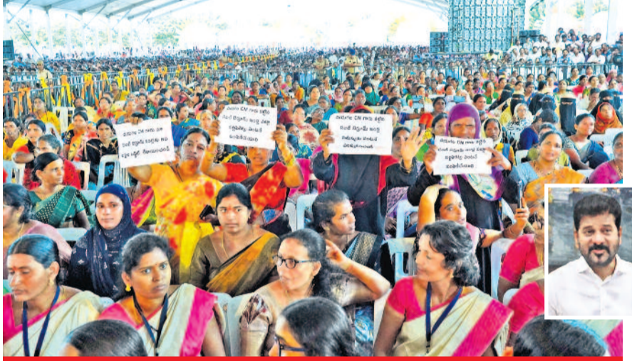
డబుల్ బెడ్రూం ఇండ్ల పట్టణాన్ని సీఎంకు మహిళల నిరసన

మెజార్టీ రైతులకు సర్కారు మొండి చేయి అర్హత ఉన్నా మాఫీ కాలేదంటున్న రైతులు ఎక్కడిక్కడ ఏకాహ్వానం, బ్యాంకర్ల నిలబేత 70 లక్షల మంది రైతులకు రుణ ఖాతాలు ఉన్నాయన్న ముఖ్యమంత్రి రేవంత్ రెడ్డి రుణమాఫీ అమలు మాత్రం 32 లక్షల మందికే మొదట 39 వేల కోట్లు అవసరమన్న సీఎం తాజాగా రూ. 31 వేల కోట్లకు తగ్గించిన వైనం బడ్జెట్లో మాత్రం 26 వేల కోట్ల కేటాయింపు