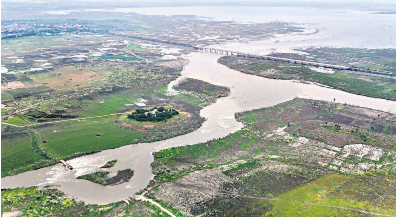
కాళేశ్వరం పండ్ హాల్ నుంచి నీటిని ఎత్తిపోయడంతో మధ్య మానేరుకు చేరుతున్న గోదావరి జలాలు

అబద్ధాలు ఆవిరయ్యాయి. కుట్రలు కొట్టుకుపోయాయి. కుర్చీ ఎక్కింది మొదలు కాళేశ్వరాన్ని టూల్గెట్ చేసి, దానిని ఎందుకూ పనికిరానిదిగా చిత్రించడం ప్రయత్నం చేసినది కాంగ్రెస్.