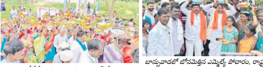
బీబీపేట మండలం మాందాపూర్ లో..