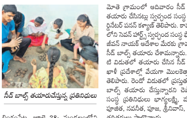
సీడ్ బాల్స్ తయారీ చేస్తున్న ప్రజానిధులు