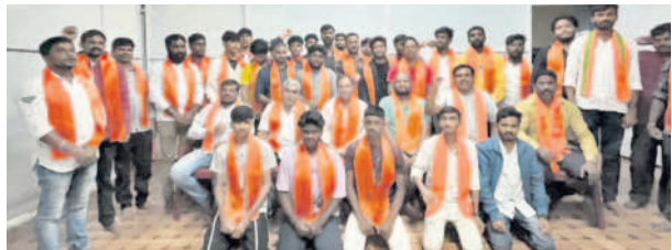
నూతన కార్యవర్గ సభ్యులు