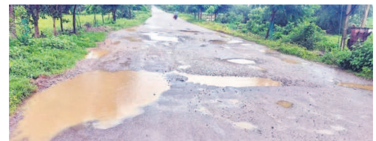
బస్సు స్టాండ్ పల్లి దాగ్లూగు వద్ద రోడ్డుపై ఏర్పడిన గుంతలు

ముఖ్యంగా ఎల్లారెడ్డి నియోజకవర్గ పరిధిలోని బస్సు స్టాండ్, ఆర్కాడ, కొండారపూర్, ఎల్లారెడ్డిపల్లి, గుండారం, సిద్ధాపూర్ గ్రామాల మీదుగా వెళ్లే రోడ్డు పూర్తిగా గుంతలమయమైంది. గుంతల్లో పడి దిగిన ప్రయాణికులు ప్రమాదాలకు గురవుతున్నారని సంబంధిత అధికారులు మాత్రం పట్టించుకోవడం లేదని స్థానికులు ఆవేదన వ్యక్తం చేస్తున్నారు. ఇప్పటికైనా ప్రజాప్రతినిధులు, అధికారులు స్పందించి రోడ్డు మరమ్మత్తులు చేపట్టాలని కోరుతున్నారు.