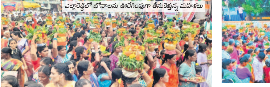
ఎల్లారెడ్డిలో బోనాలను ఊరేగింపుగా తీసుకెళ్లిన మహిళలు

మందు పిచికారీ చేయించిన, ఖర్చు కూడా తక్కువ అవుతుందని రైతులు అంటున్నారు.