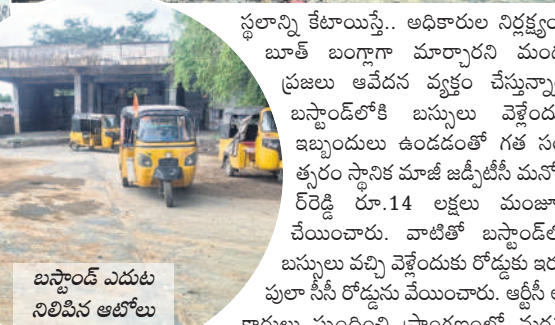
బస్టాండ్ ఎదుట ఏర్పాటు చేసిన బస్ నిలిపిన ఆటోలు

చదంతో ఆర్టీసీ ద్వారా కంట్రోల్ లోకి పోయి సిబ్బందిని ఏర్పాటు చేశారు. కాలక్రమేణా సిబ్బందిని తొలగించడంతో.. అవి శిధిలావస్థకు చేరుకున్నాయి. ప్రాంగణంలో కుర్చీలు, దిమ్మెలు ధ్వంసం చేయడం, విద్యుత్ సరఫరా లేకపోవడంతో కనీస సౌకర్యాలను కరువయ్యాయి. బస్సులు కూడా బస్టాండ్ లోకి రావడం లేదు. ఆర్టీసీ గ్రామానికి చెందిన రూ. కోట్ల విలువైన కారులు చేపట్టి వినియోగంలోకి తీసుకురావాలని ప్రయాణికులు కోరుతున్నారు. అధికారులు స్పందించకుండా తాము కేటాయించిన రెండు ఏకరా భూమిని తిరిగి స్వాధీనం చేసుకోవడానికి ఉద్ద్యమం చేస్తుమని నాగిరెడ్డిపేట వాసులు హెచ్చరిస్తున్నారు.