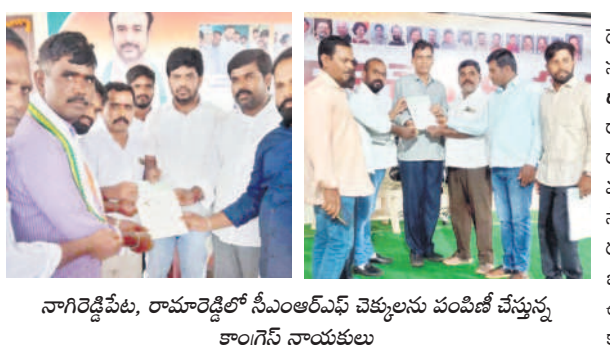
నాగిరెడ్డిపేట, రామారెడ్డిలో సీఎంఆర్ఎఫ్ చెక్కులను పంపిణీ చేస్తున్న కాంగ్రెస్ నాయకులు