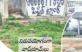
నిరుపయోగంగా వాషింగ్ మేలు