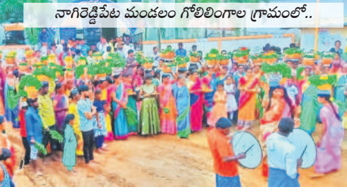
నాగిరెడ్డిపేట మండలం గోలిలింగా గ్రామంలో..

బాన్సువాడ/ గాంధారి/ లింగంపేట/ మద్యూర్/ నాగిరెడ్డి పేట/ ఎల్లారెడ్డి రూరల్/ బీబీపేట/ డోమకొండ, జూలై 28 : గాంధారి మండల ప్రజలు పన బోనాలకు తరలివెళ్లారు. ఆషాఢ మాసం చివరి ఆదివారం కావడంతో ఆయా గ్రామాల ప్రజలు గ్రామ దేవతలకు మొక్కులను చెల్లించుకున్నారు. బోనాలు తీసి, మేకలను బలిచ్చారు. పెల్లూపాపలు బాగుండాలని, పంటలు బాగా పండాలని దేవతలను వేడుకున్నారు. గ్రామాల్లో సందడి వాతావరణం నెలకొన్నది. లింగంపేట మండలంలోని లింగంపేట, లింగంపేట, బిల్లూపూర్, శెట్టిపల్లి, శెట్టిపల్లి, నాగిరెడ్డి, పోయ్యపేట, కేమట్లపల్లి, పోయ్యపల్లి, మొంగారం తదితర గ్రామాల్లో వనశోభనాలకు తరలివెళ్లారు. గ్రామ దేవతలకు పూజలు నిర్వహించి, విందు బోజనాలు చేశారు. మద్యూర్ లో కుల సంఘాల ఆధ్వర్యంలో బోనాల పండుగను నిర్వహించారు. ప్రతి సంవత్సరం ఆషాఢమాసంలో గ్రామ దేవతలకు బోనాలను సమర్పించి, మొక్కులు చెల్లించుకుంటూమని గ్రామస్థులు తెలిపారు. బండమిత్రులను ఆహ్వానించి పన బోజనాలు చేశారు. నాగిరెడ్డిపేట మండలంలోని గోలిలింగా గ్రామంలో దుర్గమ్మ, పోవమ్మకు బోనాలను సమర్పించారు. బోనాల ఊరేగింపులో పోతరాజుల విన్నాసాలు ఆకట్టుకున్నాయి. భక్తులకు ప్రసాద వితరణ చేశారు. ఎల్లారెడ్డి లింగాల పరిధిలోని గండిమాసానిపేట్ గ్రామంలో పోవమ్మ, దుర్గమ్మకు ప్రత్యేక పూజలు చేసి బోనాలను సమర్పించారు. బీబీపేట మండలంలోని మాందాపూర్ గ్రామంలో కోట మైనమ్మ ఆలయం, డోమకొండ మండల కేంద్రంలోని కనక దుర్గ ఆలయంలో బోనాల పండుగను ఆదివారం ఘనంగా