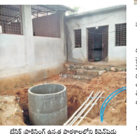
కేసీఆర్ ప్రాక్టీసింగ్ ఉన్నత పాఠశాలలోని కెపిఎడ్ల

మహబూబ్ నగర్ విద్యావిభాగం, జూలై 28 : తెలంగాణ తొలి ముఖ్యమంత్రి కె.చంద్రశేఖరరావు ప్రభుత్వ పాఠశాలల్లో కొర్రోలేట్ స్టాను విద్యా సౌకర్యాలు కల్పించాలన్న సంకల్పంతో 'మన ఊరు-మనబడి' కార్యక్రమాన్ని అత్యంత ప్రతిష్టాత్మకంగా ప్రారంభించారు. ఈ పథకం కొనసాగింపుపై కాంగ్రెస్ ప్రభుత్వం ఏర్పాటు చేసిన నీలినీడలు కమ్యుకుంటున్నాయి. జిల్లాలో రూ.16 కోట్ల బిల్లులు పెండింగ్లో ఉండడంతో కాంట్రాక్టర్లకు పనులు చేసేందుకు ముందుకు రావడం లేదు. మన ఊరు-మనబడి కార్యక్రమంలో భాగంగా పాఠశాలలో అదనపు తరగతి గదులు, డైనింగ్ హాలు, తాగునీరు, విద్యుత్, మేజర్, మైనర్ రివేర్లు ఇలా మొత్తం పన్నెండు రకాల పనులను చేపట్టాలన్నది అప్పటి ప్రభుత్వ లక్ష్యం. ఇందుకు రూ.కోట్ల నిధులు తేటాయించి కాంట్రాక్టర్లకు పనులు అప్పగించింది. కాంగ్రెస్ ప్రభుత్వం కొలువు దీరాక పనులు పూర్తిగా పడతాయని. జిల్లాలో 291 పాఠశాలలను మొదటి విడతలో వివిధ రకాల పనులకు ఈ కార్యక్రమం కింద ఎంపిక చేశారు. ఇందుకూ రూ.125 కోట్ల ప్రతిపాదనలతో పలు పాఠశాలల్లో హాళిక వసతులు, బ్లాక్లోర్లు స్థానంలో గ్రీన్ బోర్డులు, అభయిత వసతులతో కూడిన బోజున శాల, ద్యాయుల్ డెస్కీలు, మరుగుదొడ్లు వంటివి కల్పించాలన్న లక్ష్యంతో అధికారులు ముందుకు సాగారు. కానీ