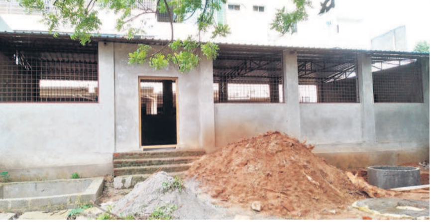
మహబూబ్ నగర్ జిల్లా కేంద్రంలోని కేసీఆర్ ప్రాక్టీసింగ్ ఉన్నత పాఠశాలలో తుది దశలో ఉన్న డైనింగ్ హాలు

కాంగ్రెస్ ప్రభుత్వం బిల్లులు విడుదలలో జాప్యం చేయడంతో పనులు ముందుకు సాగక పడినవి. ఇలా చోట్ల ఎక్కడి పనులు అక్కడి నిలిచిపోయాయి. కొన్నిచోట్ల తరగతి గదులు కూల్చివేయడం.. కొత్తవి పూర్తి కాకపోవడంతో విద్యార్థులు ఇబ్బందులు ఎదురవుతున్నాయి.