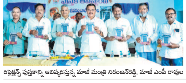
రిష్టెక్షన్స్ పుస్తకాన్ని ఆవిష్కరిస్తున్న మాజీ మంత్రి నిరంజన్ రెడ్డి, మాజీ ఎంపీ రావుల