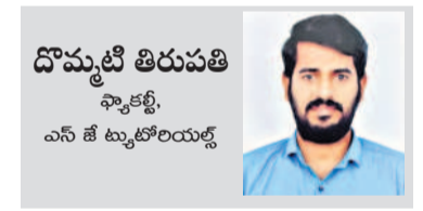
దొమ్మటి తిరుపతి స్వామి, ఎన్ టీ ట్యూటోరియల్స్

జవాబు - ఎ వివరణ - కల్వకుంట్ల చంద్రశేఖర్ రావు 1954, ఫిబ్రవరి 17న సిద్దిపేట జిల్లాలోని చింతమడక గ్రామంలో జన్మించారు. కేసీఆర్ మొదటి కాంగ్రెస్ పార్టీలో చేరాడు. మెదక్ జిల్లా యాత్ కాంగ్రెస్ లీడర్ గా పనిచేశాడు. 1982లో ఎన్టీఆర్ తెలుగుదేశం పార్టీని స్థాపించిన తర్వాత కేసీఆర్ కాంగ్రెస్ పార్టీని విడిచి టీడీపీలో చేరాడు. 1983లో సిద్దిపేట నియోజకవర్గం నుంచి టీడీపీ పార్టీ తరఫున ఎమ్మెల్యేగా పోటీచేసి తన రాజకీయ గురువు అయిన మదన్ మోహన్ చేతిలో ఓడిపోయాడు. 1985-2004 మధ్య కాలంలో కేసీఆర్ వరుసగా ఆరుసార్లు (1985, 1989, 1994, 2001, 2004) ఎమ్మెల్యేగా గెలుపొందారు. ▶ 1996-99 మధ్య కాలంలో చంద్రబాబు మంత్రివర్గంలో కేసీఆర్ రవాణా శాఖ మంత్రిగా పనిచేశాడు. 1999 ఎన్నికల తర్వాత కేసీఆర్ కు డిప్యూటీ స్పీకర్ పదవిని కేటాయించారు. 2000లో చంద్రబాబునాయుడి ఆధ్వర్యంలో తయారైన 'విజన్ 2020' డాక్యుమెంట్లోని అంశాలు సమగ్ర కేసీఆర్ ఆ డాక్యుమెంట్లో ప్రస్తావించిన పత్రం 'హరిజనులు, గిరిజనులు, వెనుకబడిన వర్గాల, మైనారిటీల ప్రసక్తిలేని పత్రం ఇదేం పత్రం? ఇందులో తెలంగాణ అభివృద్ధి గురించి ప్రస్తావనలేమీ ఎందుకని?' ప్రస్తావించారు. చంద్రబాబు 2000 సంవత్సరంలో విద్యుత్ ఛార్జీలు పెంచుతూ తీసుకున్న నిర్ణయాన్ని వ్యతిరేకిస్తూ చంద్రబాబుకు లేఖ రాశారు. ఈ లేఖ సారాంశాన్ని పత్రికలు 'తెలంగాణ రైతులకు ఉన్న గోటి ఊడిపోతుంది' అనే శీర్షికతో ప్రచురించాయి.