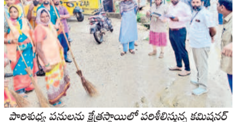
పాలిశుద్ధ పనులను ప్రోత్సహించే పాలిశుద్ధ కమిషన్

వరంగల్, జూలై 27: పాలిశుద్ధ నిర్వహణ సమర్థవంతంగా నిర్వహించాలని, అలసత్వం వ్యాప్తి సహించేది లేదని గ్రేటర్ కమిషన్ ఆర్డీవో తానాశీ వాకడే హెచ్చరించారు. శనివారం గ్రేటర్ పరిషత్లోని పరిశిల్పాలు, పెగడ పల్లె, ముచ్చర్ల, విజయలక్ష్మి కాలనీలో వచ్చేటి అలసత్వం వ్యాప్తి పనులను పరిశీలించారు. విద్యల్లో నిర్వహించిన ఇద్దరు శానిటర్ ఇన్చార్జ్లకు కమిషన్ మండలంలో పాటు. జనాభా గాడి పరిశీలన, సంగం రోడ్లోని కార్యాలయ సంగం ప్రసాదాని డిఆర్డీవో నోటిఫికేషన్ ఇవ్వాలని సీఎంపీఎస్ రాజేశ్వరి ఆదేశించారు. అసెంబుల పాలిశుద్ధ కార్యాలయ హజారు పట్టణంలో పరిశీలించారు. హజారు వేసిన సిబ్బంది విద్యల్లో ఉన్నారా? అనే విషయాన్ని నిర్వహించే సమస్యలు, రెండు రోజుల పాలిశుద్ధ వివరాలను అడిగి తెలుసుకున్నారు. కార్మికులు ఏ ఏ ప్రాంతాల్లో విధులు నిర్వహిస్తున్నారో అడిగి వెళ్ళి పరిశీలించారు. అర్బన్ మలేరియా సిబ్బంది రోజు వారీగా చేసే పనులు, డోసుల నివారణకు ఉపయోగించే