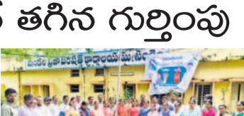
వీడ్కోలు పలుకుతున్న ఉద్యోగులు