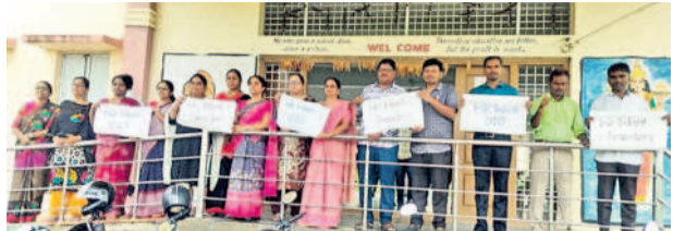
నిరసన తెలుపుతున్న మోడల్ సూల్ టీచర్లు