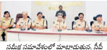
సమీక్ష సమావేశంలో మాట్లాడుతున్న సీఎంబి

సీఎంబి కిశోర్ రూ సుబేదారి, జూలై 27 : డయల్ 100 ఫిర్యాదులపై వెంటనే పోలీసు అధికారులు, సిబ్బంది స్పందించాలని వరంగల్ పోలీసు కమిషనర్ అంబర్ కిశోర్ రూ ఆదేశించారు. కమిషనర్లే బిట్టావేల, పెల్లెకార్ పోలీసు అధికారులు, సిబ్బందితో శనివారం హనుమాండులోని సీఎంబి కిశోర్ రూ కార్యాలయంలో సమావేశం నిర్వహించారు. డయల్ 100 ఫిర్యాదులపై మరింత మెరుగైన సేవలు అందించాలని, నిర్దేశించిన సమయంలో చేరుకోవాలన్నారు. శాంతిభద్రతల విషయంలో సమావేశం నిర్వహించాలని, రౌడీషీ