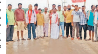
ధర్నా చేస్తున్న ఆయా సంఘాల నాయకులు

కల్వకుర్తి రూల్స్, జూలై 26 : రఘుపతిపేట గ్రామ సమీపంలోని దుందుబి వాగుపై బ్రిడ్జి నిర్మాణ పనులను వెంటనే ప్రారంభించాలని సీపీఎం నాయకులు డిమాండ్ చేశారు. శుక్రవారం కల్వకుర్తి మండలం రఘుపతిపేట ప్రధాన రహదారిపై సీపీఎం, ఆయా సంఘాల నాయకులు ధర్నా చేపట్టారు. ఈ సందర్భంగా వారు మాట్లాడుతూ బ్రిడ్జి మంజూరై ఏండ్లు గడుస్తున్నా పనులు ప్రారంభించలేదన్నారు. వానకాలంలో నది ఉధృతంగా ప్రవహించడంతో కల్వకుర్తి, తెల్లపల్లి మండలాలకు రాకపోకలు నిలిచిపోతున్నాయి. ప్రజాప్రతినిధులు, అధికారులు చొరవ తీసుకుని పనులను వేగంగా ప్రారంభించజేయాలని డిమాండ్ చేశారు. కార్యక్రమంలో సీపీఎం