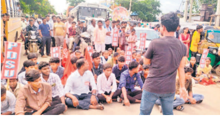
సింగారం చౌరస్తాలో రాస్త్రాలోకో చేస్తున్న షీడిఎస్‌యూ నాయకులు