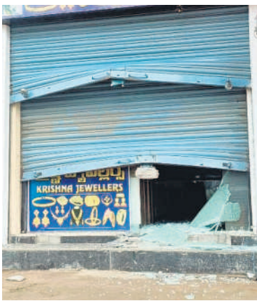
ధ్వంసమైన బంగారు దుకాణం పెట్రోల్