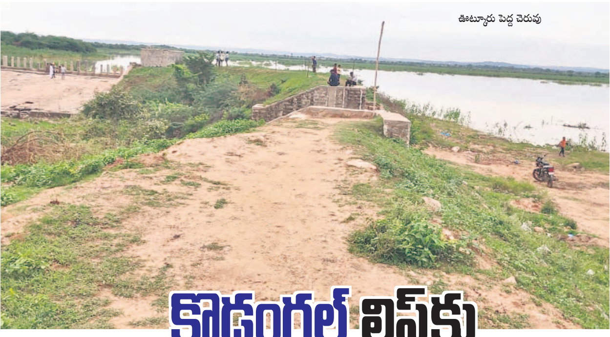
ఊటూరు పెద్ద చెరువు