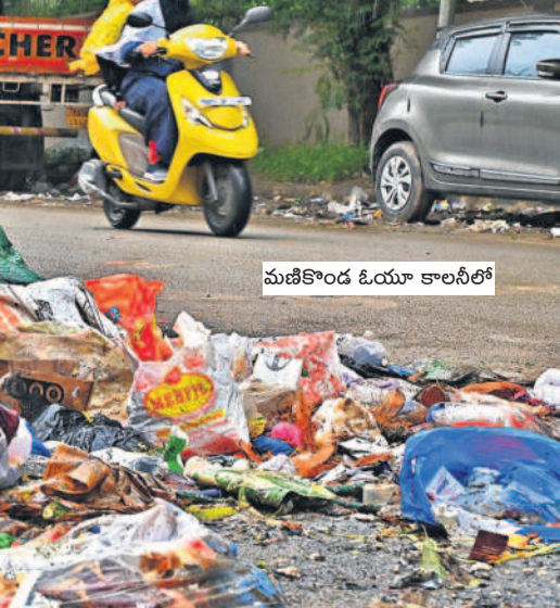
మణికోడల్ ఓయూ కాలనీలో

గ్రేటర్లో పారిశుధ్య నిర్వహణ గాడి తప్పకుండా తరలింపేందుకు వర్షకాలంలో ప్రత్యేక ఏర్పాట్లు చేయడం లేదు. వర్షాల్లోనే డోములు, ఈగలు, క్రమికిణులు వృద్ధి చెంది రోగాలు వ్యాపించే ప్రమాదం పొంది ఉన్నది. ఇప్పటికీ మలేరియా, డెంగి కేసులు విజృంభిస్తున్నాయి. ఈ నేపథ్యంలోనే వర్షకాలంలో పారిశుధ్య నిర్వహణకు మరింత మెరుగైన చర్యలు తీసుకోవాలని ప్రజలు వేడుకుంటున్నారు.