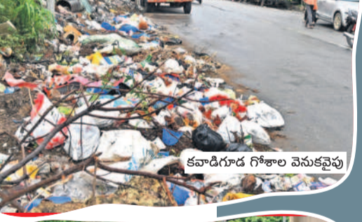
కనాడిగూడ గోశాల వెనుకవైపు