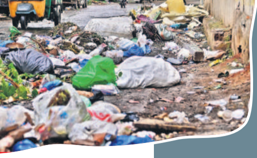
గాంధీ వైద్యశాల వెనకాల