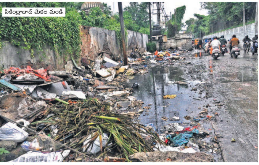
సికింద్రాబాద్ మేకల మండీ

సీకింద్రాబాద్, జూలై 24 (నమస్తెలంగాణ) : గ్రేటర్లో పారిశుధ్య నిర్వహణ గాడి తప్పకుండా తరలింపేందుకు వర్షకాలంలో ప్రత్యేక ఏర్పాట్లు చేయడం లేదు. వర్షాల్లోనే డోములు, ఈగలు, క్రమికిణులు వృద్ధి చెంది రోగాలు వ్యాపించే ప్రమాదం పొంది ఉన్నది. ఇప్పటికీ మలేరియా, డెంగి కేసులు విజృంభిస్తున్నాయి. ఈ నేపథ్యంలోనే వర్షకాలంలో పారిశుధ్య నిర్వహణకు మరింత మెరుగైన చర్యలు తీసుకోవాలని ప్రజలు వేడుకుంటున్నారు.