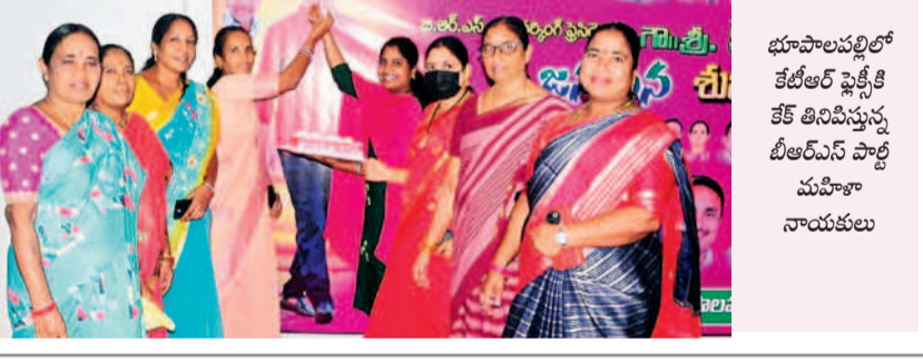
భూపాలపల్లిలో కేటీఆర్ ఫ్లేట్ కి కేక్ కట్టిన దాస్యం, బీఆర్ఎస్ పార్టీ మహిళా నాయకులు