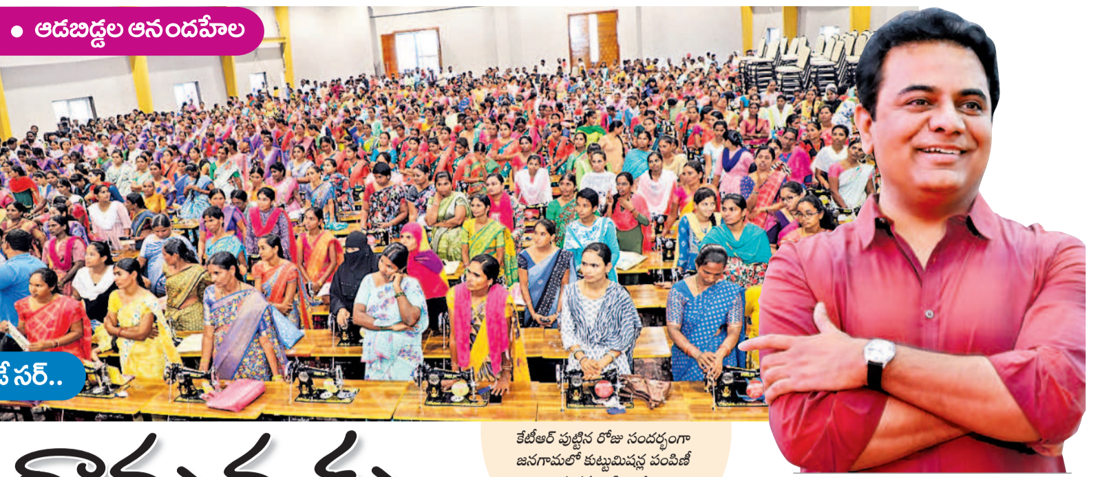
కేటీఆర్ పుట్టిన రోజు సందర్భంగా జనగామలో కుటుంబవృద్ధి పంపిణీ కార్యక్రమానికి భారీగా తరలివచ్చిన మహిళలు