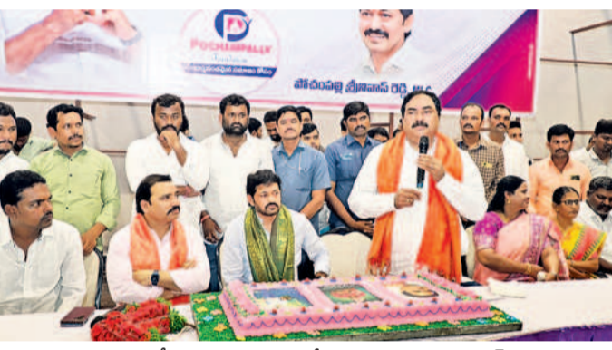
జనగామలో మాట్లాడుతున్న మాజీ మంత్రి ఎర్రబెల్లి దయాకరరావు

పండుగలా బీఆర్ఎస్ వర్కింగ్ ప్రెసిడెంట్ కేటీఆర్ పుట్టిన రోజు వేడుక