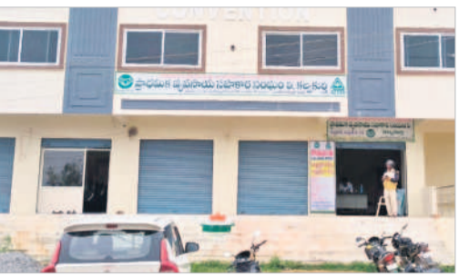
కల్వకుర్తిలో ప్రాథమిక వ్యవసాయ సహకార సంఘం బ్యాంక్, కుంభం కృష్ణయ్య రూ.1.60 లక్షల రుణం తీసుకుంటే కేవలం రూ.64,480 మాత్రమే మాఫీ అయినట్లు ఫోన్ కు వచ్చిన మెసేజ్

రైతు సంక్షేమానికి, వికాసానికి కట్టుబడి ఉన్న ప్రజా ప్రయత్నం 'రైతు ముఖ మాఫీ - 2024' కింద శ్రీ KUMBAM KRISHI గ్రాంట్, రూ.64430/- బ్యాంక్ ఖాతా నంబర్ XXXXX9036 APGBV HYDERABAD X బ్రాంచ్ యందు తేది 18.07.2024 న జమ చేయబడినది. వివరాలకు మీ బ్యాంక్ అధికారిని/ముండల వ్యవసాయ అధికారిని సంప్రదించగలరు. మీ ఈ ఆనందంలో పాలుపంచుకోవడం నాకెంతో సంతోషంగా ఉంది. మీ ముఖ్యమంత్రి శ్రీ ఎన్మమల రేవంత్ రెడ్డి.