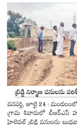
బ్రిడ్జి నిర్మాణ వసూలను పరిశీలిస్తున్న మాజీ మంత్రి నిరంజన్ రెడ్డి

• బ్రిడ్జి వసూల పరిశీలనలో మాజీ మంత్రి సింగిరెడ్డి నిరంజన్ రెడ్డి