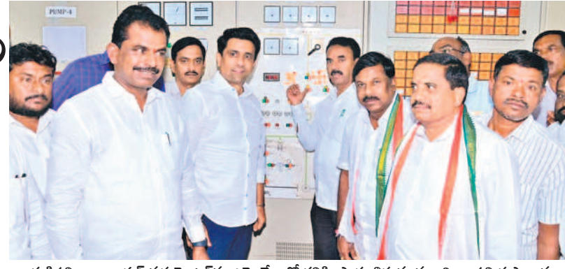
గుడిపల్లి రిజర్వాయర్ వద్ద మోటర్లను ఎమ్మెల్యేలతో కలిసి ప్రారంభిస్తున్న మంత్రి జూపల్లి కృష్ణారావు

వంశం చేసేలా పర్యటన తీసుకున్నట్లు మంత్రి తెలిపారు. ఉమ్మడి జిల్లాల ప్రాజెక్టులను పూర్తి చేసేందుకు ముఖ్యమంత్రి కృతనిశ్చయంతో ఉన్నారన్నారు. అనంతరం కృష్ణయ్యకు పూలతో స్వాగతం పలికారు. అంతకు ముందు ఇంజనీరింగ్ అధికారులతో మంత్రి సమావేశం చేసి బిడ్డే విషేన తెలిపారు.