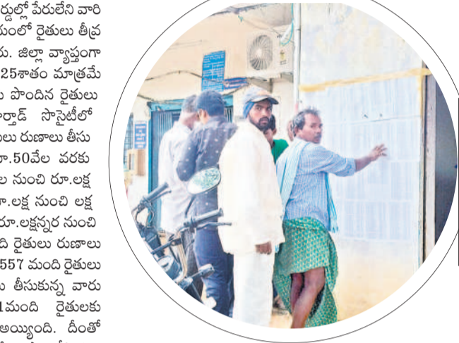
కోటగిరి ఎస్బీఐ ఎదుట ప్రదర్శించిన రుణమాఫీ జాబితాను బుధవారం పరిశీలిస్తున్న రైతులు

మోర్చాడ్, జూలై 24: రాష్ట్రవ్యాప్తంగా మొదటి విడుదల రూ.లక్షల్లోపు రుణ మాఫీ చేస్తున్నామని ప్రభుత్వం ప్రకటించి జాబితా వెల్లడించిన కనబడుతున్నాయి. మోర్చాడ్ సొసైటీలో మొత్తం 886 మంది రైతులు రుణాలు తీసుకున్నారు. ఇందులో రూ.50వేల వరకు 401 మంది, రూ.50వేల నుంచి రూ.లక్ష వరకు 156 మంది, రూ.లక్ష నుంచి రూ.2లక్షల వరకు 54 మంది రైతులు రుణాలు తీసుకున్నారు. ఇందులో 557 మంది రైతులు రూ.లక్ష వరకు రుణాలు తీసుకున్న వారు ఉండగా కేవలం 61మంది రైతులకు మాత్రమే రుణమాఫీ అయ్యింది. దీంతో వ్యవసాయాధికారులు అంటున్నారు. ఈ పరిస్థితుల్లో రేషన్ కార్డులు లేనివారు, రేషన్ కార్డు ఉన్నా ఆందులో పేరు లేనివారు, గల్ఫ్