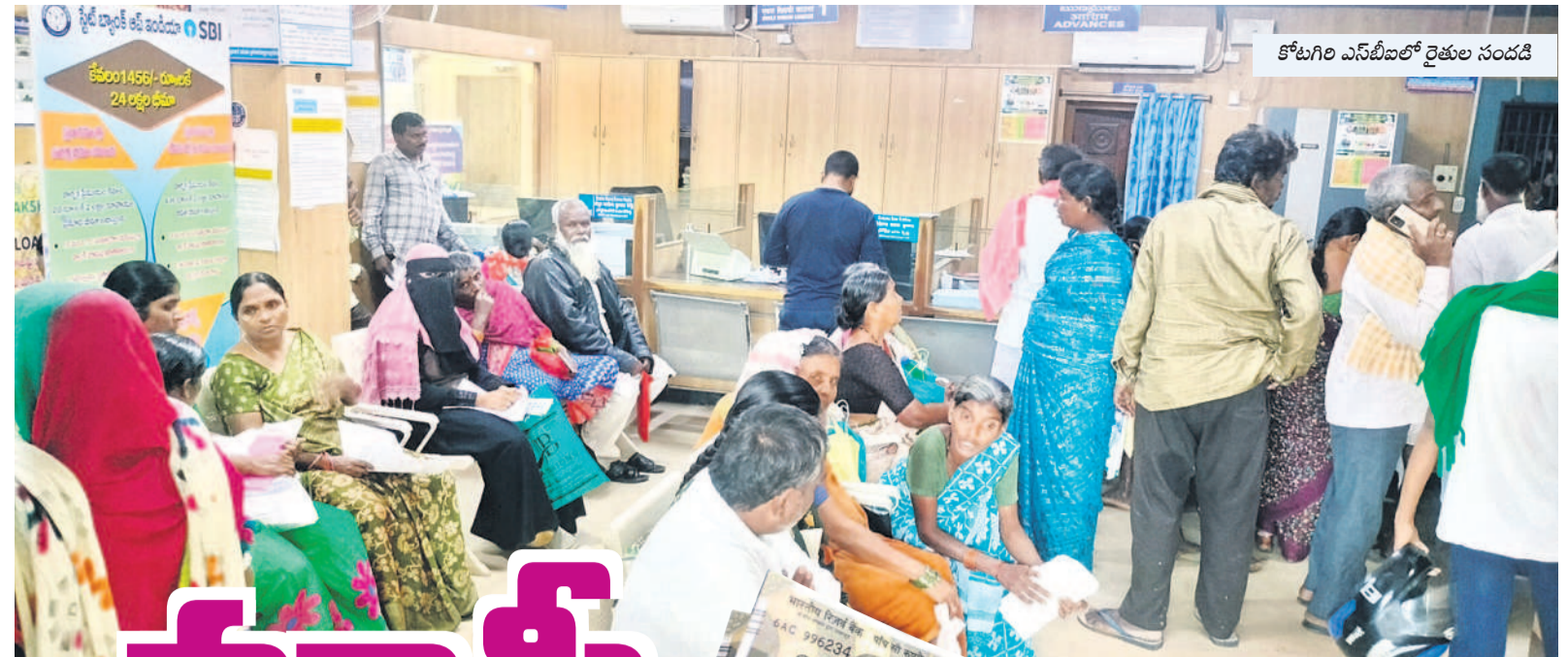
కోటగిరి ఎస్బీఐలో రైతుల సందడి

పరదాలో రక్షణగా.. నిజామాబాద్ జిల్లాలోని మూడో అంతస్తులో కిటికీలకు ఉన్న అద్దాలు ఇటీవల పగిలిపోయాయి. వర్షం కురిసిన సమయంలో కిటికీల ద్వారా రోగులు ఉండే వాడల్లో నీళ్ళు వస్తున్నాయి. దీంతో రోగులు ఇబ్బందులు ఎదుర్కొంటున్నారు. ఈ సమస్యలో వాన నీరు లోపలికి రాకుండా కిటికీలకు అడ్డంగా రోగుల బెడల మధ్య ఉండే పరదాలను పెట్టారు. ఇప్పటికైనా అధికారులు స్పందించి మరమ్మత్తులు చేయవాలని రోగులు కోరుతున్నారు.