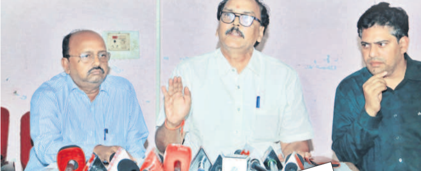
విలేజరులతో మాట్లాడుతున్న ఫ్యాక్టరీ వైస్ ప్రెసిడెంట్