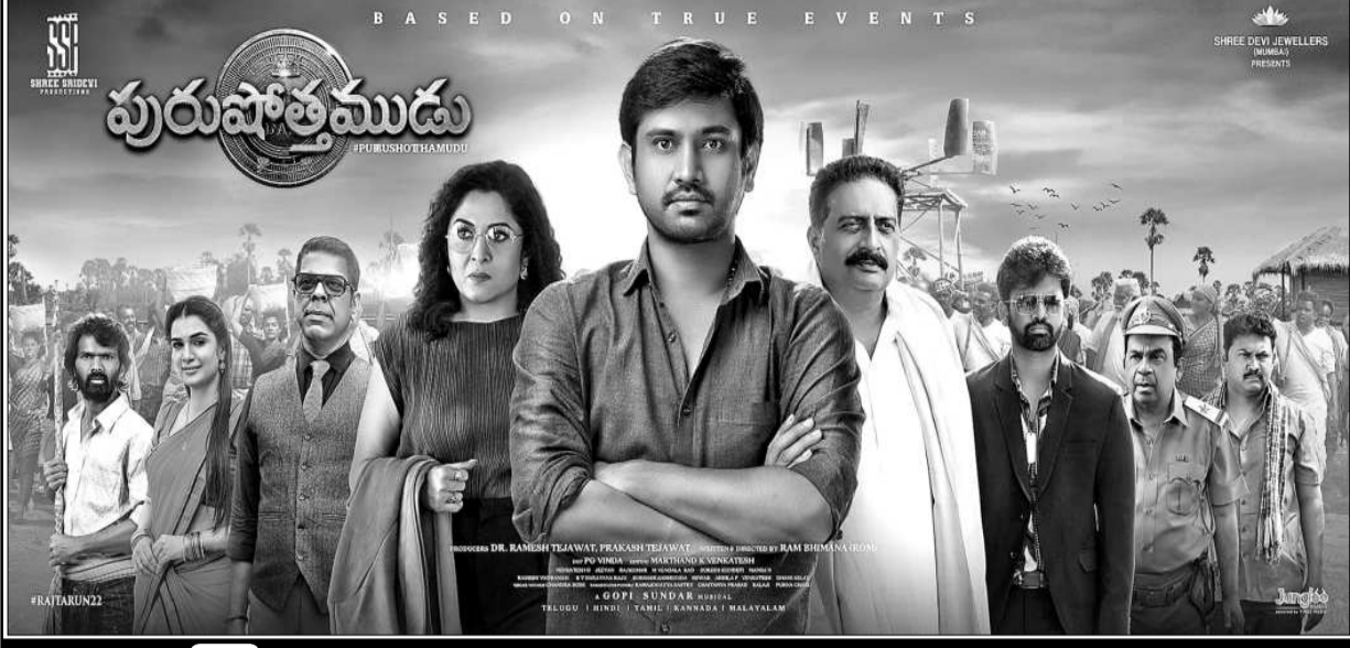
సవిత్రనాథన్ 70 ఎ/సి - ఆర్.టి.సి. క్రాస్ రోడ్స్ 11.00, 2.00, 6.00, 9.00