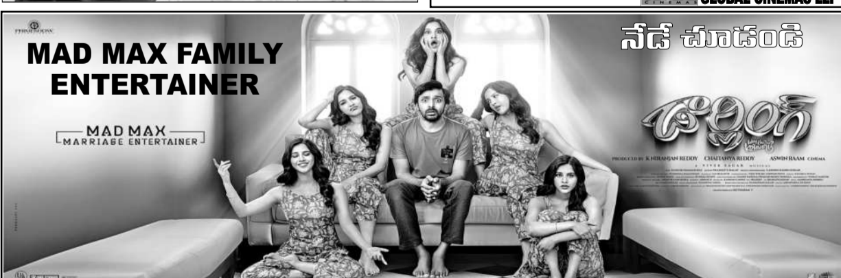
సవిత్రనాథన్ 35 ఎ/సి - ఆర్.టి.సి. క్రాస్ రోడ్స్ 11.00, 2.00, 6.00, 9.00 ENJOY 4K LASER PROJECTION & DOLBY ATMOS SOUND