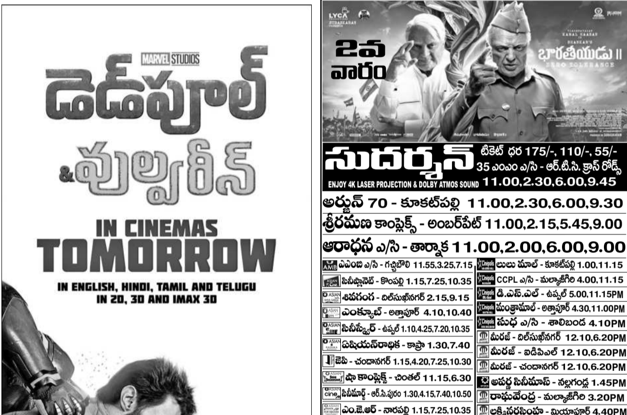
సవిత్రనాథన్ డిజిట్ ధర 175/-, 110/-, 55/- 35 ఎంఎం ఎ/సి - ఆర్.టి.సి. క్రాస్ రోడ్స్ 11.00, 2.00, 6.00, 9.45