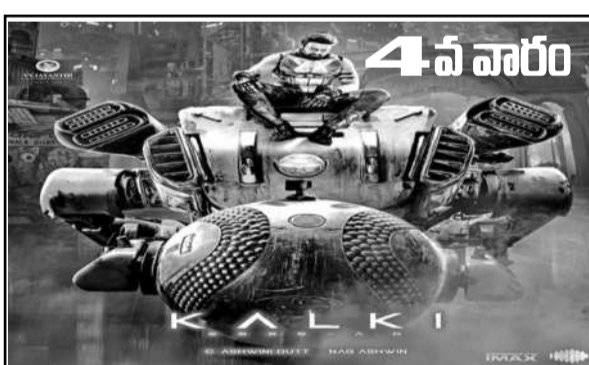
70 ఎంఎం ఎ/సి - ఆర్.టి.సి. క్రాస్ రోడ్స్ 11.00, 2.00, 15.00, 9.15 ENJOY 4K LASER PROJECTION & DOLBY ATMOS SOUND