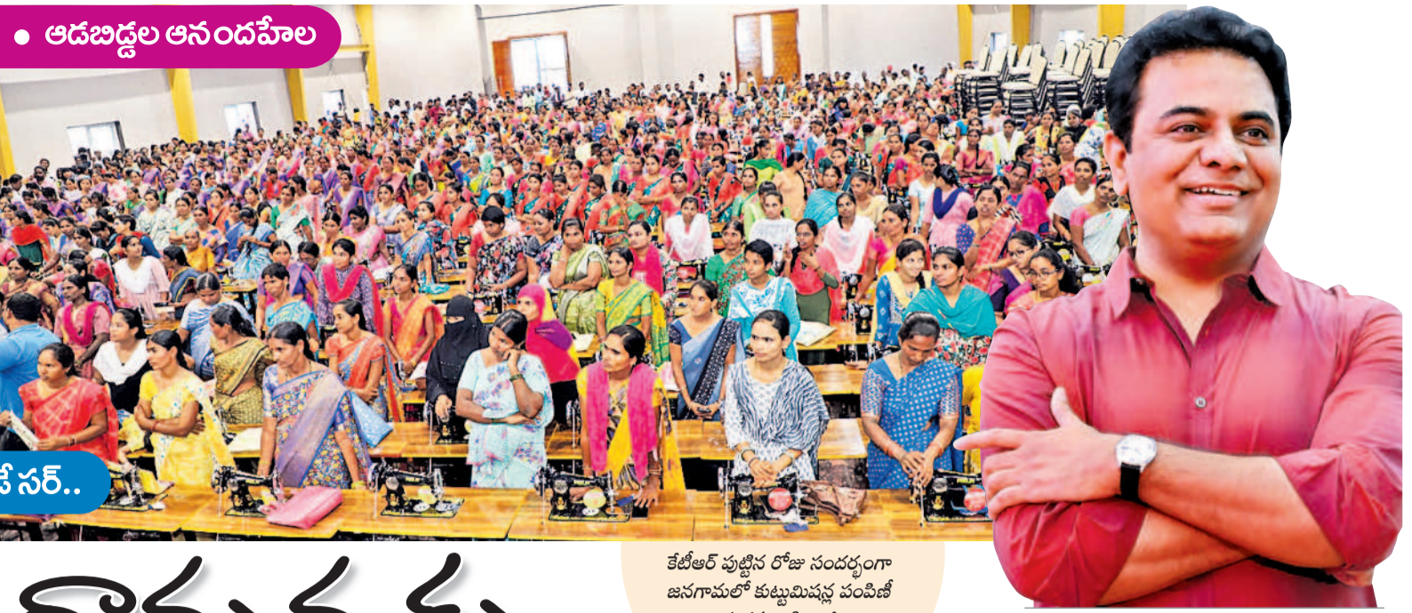
• ఆదబద్దల ఆనందవోల