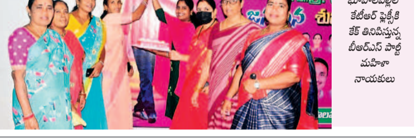
భూపాలపల్లిలో కేటీఆర్ ఫ్లేట్ కి కేక్ తినిపిస్తున్న బీఆర్ఎస్ పార్టీ మహిళా నాయకులు