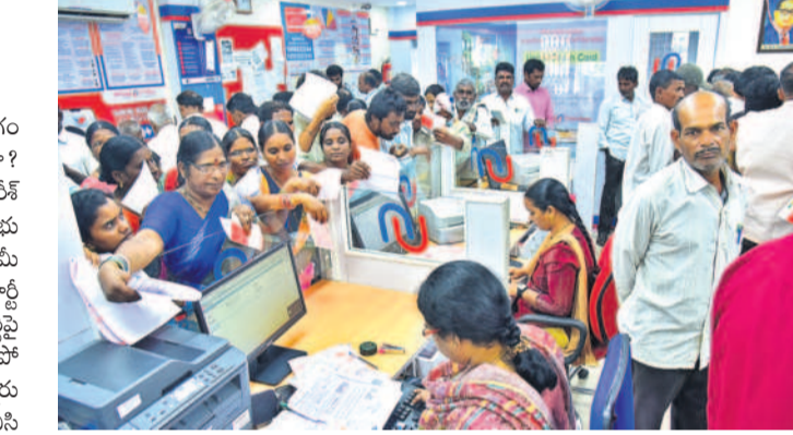
అలోచించి విసురుతాడో అర్థం చేసుకోవాల్సిన సీఎం రేవంత్ అత్యుత్సాహానికి పాటు బొక్క బోర్లా పడ్డారు.

అధికారం కోసమో, అభివృద్ధి కోసమో అబద్ధాలాడేందుకు వెనుకాడకపోవడం నేటి పాలకులు. గొప్పల కోసం అలవికాని హామీలు, అబద్ధపు వాగ్దానాలతో గద్దెనెక్కి తీరా అధికారంలోకి వచ్చాక ప్రజలను మోసం చేస్తున్నారు. 'వినాకాల్ వివరణ బుద్ధి' అన్నట్లుగా వ్యవహరిస్తున్న కాంగ్రెస్ సర్కార్ తీరును చూస్తుంటే పురాణాల్లోని ఒక సంఘటన యాదీకొస్తున్నది. భస్మాసురుడు అనే రాక్షసుడు శివభక్తుడు. శివుడి మెచ్చుకోసం అతను చాలా కాలం పాటలు తప్పకుండా పాడుతూ వచ్చాడు. అతని తపస్సుకు మెచ్చిన శివుడు ప్రభుత్వమయ్యాడు. ఏం వరం కావాలో కోరుకోమని చెప్పాడు. దీంతో అతను 'తాను ఎవరి తలపై చేయిపెడితే వారు బూడిదైపోయే' వరాన్ని ప్రసాదించాలని శివుడిని కోరుకుంటాడు. అందుకు సమ్మతించిన శివుడు అతను కోరుకున్నట్లే వరం ప్రసాదించాడు. అయితే 'వినాకాల్ వివరణ బుద్ధి' అన్నట్లుగా భస్మాసురుడు వరమిచ్చిన శివుడి తలపైనే చేయి పెట్టాలని ప్రయత్నించాడు. దీంతో విష్ణుమూర్తి సహాయాన్ని శివుడు కోరుతాడు. మారువేషంలో ఆ రాక్షసుడి వద్దకు వెళ్లిన విష్ణువు అతని తలపైనే చేయి పెట్టుకునేలా చేస్తాడు. దీంతో భస్మాసురుడు అంతమైపోతాడు.