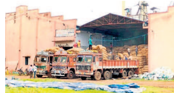
సీఎంఆర్ రైస్ మిల్లులో వడ్ల బియ్యం లాభిలో లోడ్ చేస్తున్న హామీలను

చేసి నిల్వ ఉండాలి) అధికారులు సీజ్ చేశారు. ఆ రోజు నుంచి ఇప్పటి వరకు ధాన్యంతో పాటు బియ్యం కూడా ఆ మిల్లులోనే ఉన్నాయి. అయితే సీఎంఆర్ చెల్లింపు విషయమై మిల్లు యజమాని కోర్టును ఆశ్రయించాడు. ఈ క్రమంలోనే అధికారులు సీఎంఆర్ రికవరీ పేరిట సీజ్ చేసిన ధాన్యాన్ని ఇతర మిల్లులకు కేటాయిస్తున్నారు. సీజ్ చేసిన సన్న వడ్లపై కన్నెసిన కొండరు రైస్ మిల్లర్లు, యూనియన్ నాయకులు అధికారులతో కమ్మడ్లు తమనే సదరూ చేసేలా ఒప్పందం కుదుర్చుకున్నారు. అర్బిఎన్ఆర్ వడ్లను బియ్యంగా మార్చి క్లియర్ చేశారు. 5 నుంచి రూ. 6 వేల వరకు విక్రయించి పెద్ద మొత్తంలో సామూ చేసుకోవచ్చని, బయట మార్కెట్ లో దొడ్డు బియ్యాన్ని తక్కువ ధరకు (రూ. 2 నుంచి రూ. 3 వేలు) కొనుగోలు చేసి ప్రభుత్వానికి అప్పగించవచ్చని షరతులకు ఒప్పుకున్నారు. చేసుకున్న ఒప్పందం మేరకు అధికారుల కనుసన్నల్లో ధాన్యాన్ని రెండు రోజులుగా ఆయా మిల్లులకు తరలిస్తున్నారు. అలాగే వడ్ల బియ్యం లాభిలోకి విక్రయించి యూనియన్ నాయకుడికి చెందిన వీ ట్రెడ్ లోనే కాంటా పెడుతూ తాకాల్లో సైతం అవకతవకలకు పాల్పడుతున్నారు. ఈ విషయాలపై ఇతర రైస్ మిల్లుల యజమానులు సైతం ప్రతిఘటించారు. వారి దండాకు