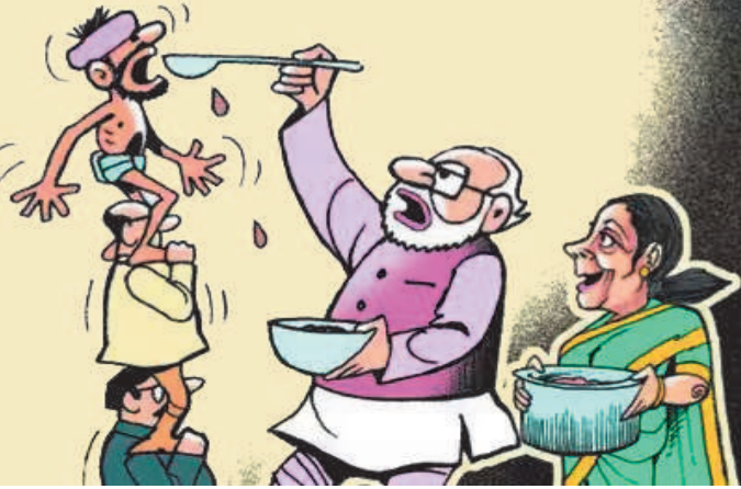
ఇంధనం, ఎరువులకు సబ్సిడీ కోసం గత ఏడాది రూ.4.13,466 కోట్లు కేటాయిం చగా, తాజా బడ్జెట్లో రూ.3,81,175 కోట్లు కేటాయిస్తున్నట్లు తెలిపారు. కేవలం ఆహారం సబ్సిడీపైనే దాదాపు రూ.7 వేల కోట్ల కోత విధించారు. దీంతో దేశంలోని దాదాపు 80 కోట్ల మందిపై ప్రభావం పడుతుందని అంచనా వేస్తున్నారు.