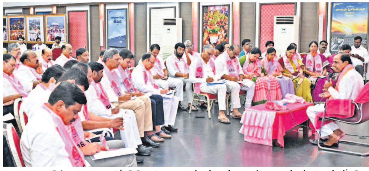
తెలంగాణభవన్ లో మంగళవారం జరిగిన బీఆర్ఎస్ శాసనసభాపక్ష సమావేశంలో ఎమ్మెల్యేలు, ఎమ్మెల్సీలకు దిశానిర్దేశం చేస్తున్న అధినేత కేసీఆర్

జాతీయ పార్టీలకు చెరో ఎనిమిది ఎంపీ సీట్లొచ్చినా.. బడ్జెట్ లో తెలంగాణకు జీరో