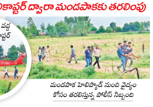
మండపాక హెలికాప్టర్ నుంచి వైద్యం కోసం తరలిస్తున్న పోలీస్ సిబ్బంది

వాజేడు, జూలై 22 : ఛత్తీస్ గఢ్ అడవుల్లో కూంబింగ్ కు వెళ్ళిన పోలీస్ బలగాలు అస్పష్టతకు గురై అడవిలో చిక్కుకున్నారు. ఇటీవల ఎలిమిడి ఎన్ఫోర్స్ మెంట్ పోలీస్ టింగి వస్తున్న క్రమంలో పెనుగోలు గుట్టల వద్ద వాగులు పొంగి ప్రవహించడంతో వచ్చే మార్గంలో అక్కడే ఉండిపోయారు. విషయం తెలుసుకున్న పోలీస్ ఉన్నతాధికారులు వారిని సోమవారం ప్రత్యేక హెలికాప్టర్ సాయంతో వాజేడు మండలం మండపాక హెలికాప్టర్ వద్దకు తీసుకొచ్చారు. అక్కడ వారికి చికిత్స అందించి ములుగు తరలించారు.