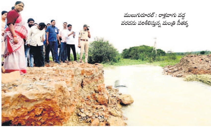
ములుగురూరల్: రాజ్ వాగు వద్ద పరదను పరిశీలిస్తున్న మంత్రి సీతక్క