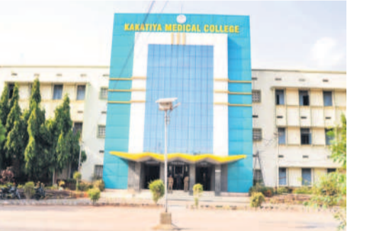
వరంగల్ చౌరస్తా, జూలై 22 : కాకతీయ మెడికల్ కళాశాల (కేఎంసీ)లో ప్రాఫెసర్ల కొరత ఏర్పడింది. బదిలీలో ప్రభుత్వం ముందు చూపు లేకుండా వ్యవహారించడంతో వైద్య విద్యార్థులకు శాపంగా మారింది. కళాశాలలో నియామకాలు చేపట్టకుండా ప్రాఫెసర్లు, అసోసియేట్ ప్రాఫెసర్లను బదిలీ చేయడం వల్ల తాము పట్టకం సమయంలో అందుబాటులో ఉన్న సగం మందిని ప్రభుత్వం బదిలీ చేయడం ఏంటని వారు ప్రశ్నిస్తున్నారు. విద్యార్థులు భవిష్యత్తును అందకారంలోకి నెడుతున్న ఈ బదిలీలను మరోసారి ప్రభుత్వం పరిశీలించి ఉత్తర్వులను వెనక్కి తీసుకోవాలని వారు కోరుతున్నారు. నేడు నేటి మెడికల్ కేఎంసీ నిబంధనల అనుసరించి మెడికల్ కళాశాలల్లో ఉన్న పనతులు, బోధనా సిబ్బందిని పరిణాలోకి తీసుకొని పీజీ సిట్ల కేటాయింపు జరుగుతుంది. ప్రస్తుతం కేఎంసీ నుంచి భారీగా ప్రాఫెసర్లు బదిలీ చేయడంతో రానున్న విద్యార్థులందరికీ అవసరమైన ప్రాఫెసర్లు అందుబాటులో లేక పీజీ సిట్ల కేటాయింపులో ఇబ్బందులు తలెత్తి అవకాశాలున్నాయని విద్యార్థులు ఆందోళన చెందుతున్నారు. ఇప్పటికే ప్రాఫెసర్ల కొరత కారణంగా ఇతర కళాశాల ప్రాఫెసర్ల ఆద్య