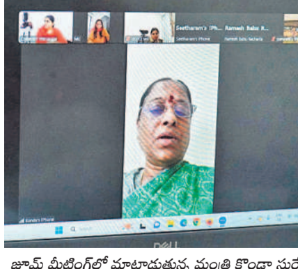
జామ్ మీటింగ్లో మాట్లాడుతున్న మంత్రి కొండా సురేష్

ర్యంలో పీజీ మెంటల్ వ్యవస్థ కొనసాగుతున్నందున, రానున్న రోజుల్లో మరింత ఇబ్బందికరంగా మారుతుందని అంటున్నారు. ప్రముఖ విభాగంలో బదిలీలు ● జనరల్ మెడిసిన్లో ఆరుగురు ప్రాఫెసర్లు, ఇద్దరు అసోసియేట్ ప్రాఫెసర్లు, ఇద్దరు అసిస్టెంట్ ప్రాఫెసర్లు బదిలీపై వెళ్ళగా నలుగురు ప్రాఫెసర్లు తీసుకున్నారు. ● మైక్రోబయాలజీ విభాగంలో ఇద్దరు ప్రాఫెసర్లు, ఒక అసోసియేట్ ప్రాఫెసర్, ఇద్దరు అసిస్టెంట్ ప్రాఫెసర్లు బదిలీపై వెళ్ళగా ఉన్నానియా నుంచి ఒక్క అసోసియేట్ ప్రాఫెసర్ మాత్రమే బదిలీపై వచ్చారు. ● జనరల్ సర్జరీ విభాగంలో ఐదుగురు ప్రాఫెసర్లు, నలుగురు అసోసియేట్ ప్రాఫెసర్లు బదిలీపై వెళ్ళగా ఒక ప్రాఫెసర్, ఒక అసోసియేట్ ప్రాఫెసర్ మాత్రమే కేఎంసీకి వచ్చారు. ● చెవి,ముక్కు, గొంతు (ఈఎన్టీ) విభాగంలో ఇద్దరు ప్రాఫెసర్లు, ఇద్దరు అసోసియేట్ ప్రాఫెసర్లు బదిలీ కాగా ఒకరు మాత్రమే నియామక పత్రం తీసుకున్నారు. ● ఆలోపతి విభాగంలో ఇద్దరు ప్రాఫెసర్లు, ఒక అసోసియేట్ ప్రాఫెసర్, నలుగురు అసిస్టెంట్ ప్రాఫెసర్లు బదిలీ అయ్యారు. ● కమ్యూనిటీ మెడిసిన్ విభాగంలో ఇద్దరు ప్రాఫెసర్లు, ఒక అసోసియేట్ ప్రాఫెసర్, ఇద్దరు అసిస్టెంట్ ప్రాఫెసర్లు బదిలీ కావడంతో ఆ విభాగం ఖాళీగా మారింది. ● సైకాలజీ విభాగంలో ఒక ప్రాఫెసర్, ఒక అసోసియేట్, ఇద్దరు అసిస్టెంట్ ప్రాఫెసర్లు బదిలీ అయ్యారు. ● రేడియాలజీ విభాగంలో ఇద్దరు అసోసియేట్, ఇద్దరు అసిస్టెంట్ ప్రాఫెసర్లు బదిలీపై వెళ్ళారు.