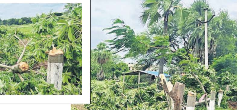
సిద్దిపేట జిల్లా నంగునూరు మండలం సిద్దిపేటలో హరితహారం చెట్లను నరికివేసిన విద్యుత్ అధికారులు