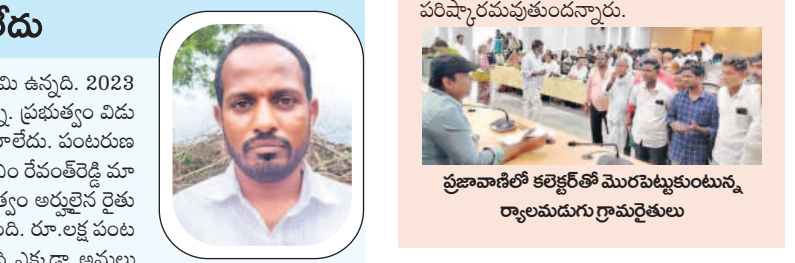
ప్రజావాణిలో కలెక్టరేట్లో మొరపెట్టుకుంటున్న రాయలమడగ గ్రామరైతులు

నాకు రుణమాఫీ కాలేదు నాకు రుణమాఫీ కాలేదు నాకు రుణమాఫీ కాలేదు