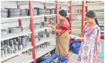
సిద్దిపేట పట్టణంలోని స్ట్రీట్ బ్యాంక్