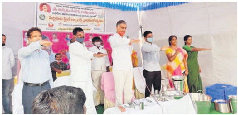
సిద్దిపేటలో స్ట్రీట్ బ్యాంక్ ప్రారంభోత్సవంలో షాన్వాజ్ వాదమని ప్రజలకు ఎమ్మెల్యే హరిశ్ చంద్ర

పార్లమెంట్ ఎకనామిక్ సర్వే ఆఫ్ ఇండియా బుక్లో సిద్దిపేట స్ట్రీట్ బ్యాంక్ గురించే ప్రచురణ అధికారులు, ప్రజలకు అభివృద్ధి తిలపిన మాజీ మంత్రి, సిద్దిపేట ఎమ్మెల్యే హరిశ్ చంద్ర