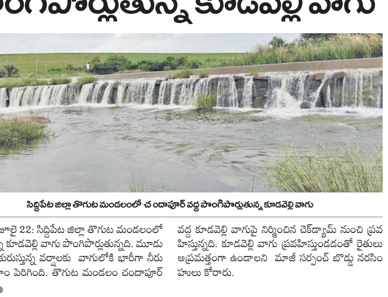
సిద్దిపేట జిల్లా తిరుగుమండలంలో చందాపూర్ వద్ద పాంగిపార్లుతున్న కూడవెల్లి వాగు

సింగూరుకు వరద సింగూరుకు వరద సింగూరుకు వరద