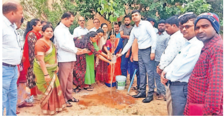
సిద్దిపేట జిల్లా జగద్విపూర్ మండలంలోని కేజీబీ ఆవరణలో మొక్కనాటి సీరుపోస్టు కలెక్టర్ మనుచౌదరి

సర్కారు బడుల బలోపేతానికి వసతుల కల్పన సిద్దిపేట కలెక్టర్ మనుచౌదరి సిద్దిపేట జిల్లా జగద్విపూర్ మండలంలో పర్యటించిన కలెక్టర్