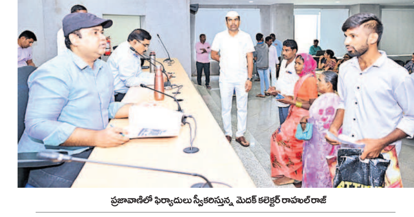
ప్రజావాణిలో ఫిర్యాదులు స్వీకరణను మెదక్ కలెక్టర్ రాహుల్ రాజ్

మెదక్, జూలై 22 (నమస్తే తెలంగాణ): సమస్యల పరిష్కారానికి ప్రజావాణి కార్యక్రమం ఏర్పాటు చేసిన నల్ల మెదక్ జిల్లా కలెక్టర్ రాహుల్ రాజ్ ప్రజలకు సూచించారు. సోమవారం మెదక్ కలెక్టరేట్లో ప్రజావాణి డాగరా వివిధ సమస్యలకు ప్రజల నుండి ఆయన ఆఫీసు స్వీకరించారు. ఈ సందర్భంగా కలెక్టర్ మాట్లాడుతూ కలెక్టర్ కార్యాలయంలో ప్రతి సోమవారం ప్రజల సమస్యలను తెలుసుకొని పరిష్కరించడానికి ప్రజావాణి కార్యక్రమం నిర్వహిస్తున్నామన్నారు. ప్రజలు