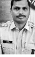
జఫర్ గడ్డ పోలీస్ స్టేషన్లో

జఫర్ గడ్డ, జూలై 22 : జఫర్ గడ్డ ఎస్పి రవిని సస్పెండ్ చేస్తూ వరంగల్ పోలీస్ కమిషనర్ అబద్ధ కిశోర్ రూ సోమవారం రాత్రి ఉత్తర్వులు జారీ చేశారు. వివరాల్లోకి వెళ్తే.. జఫర్ గడ్డ పోలీస్ స్టేషన్లో గత యేడాది సమాధైన ఓ కేసులో ఎస్పి రవి అలసత్వంగా వ్యవహరించడంతో పాటు కేసు విచారణలో పోలీస్ ఉన్నతాధికారులు తప్పుదోవ పట్టారంటూ.. బాధితు లకు న్యాయం చేయడంకు నిందితులకు సహకరిస్తూ తప్పుడు పత్రాలను సృష్టించినట్లు ఫిర్యాదుల్లో వచ్చాయి. సీబీ ఆడిటోల మేరకు పోలీసు ఉన్నతాధికారులు విచారణ జరుపగా ఎస్పి రవి అప కతవకలకు మార్గదర్శిగా నిర్దేశించి, దీంతో రవిని సస్పెండ్ చేస్తూ పోలీస్ కమి షనర్ అబద్ధ కిశోర్ రూ క్రమశిక్షణ చర్యలు తీసుకున్నారు.