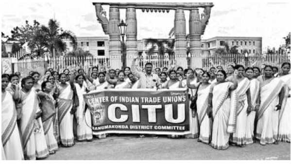
హనుమకొండ కలెక్టరేట్ ఎదుట ధర్నా చేస్తున్న ఆశ పర్యర్షి