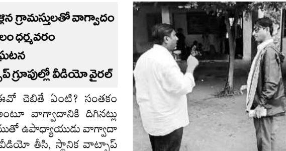
గ్రామస్థులతో వాదనకు దిగిన ఉపాధ్యాయుడు