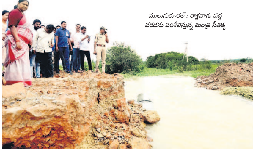
ములుగువరదను పరిశీలిస్తున్న మంత్రి సీతక్క