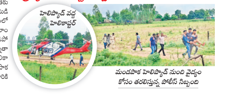
మండపాక హెలికాప్టర్ నుంచి వైద్యం కోసం తరలిస్తున్న పోలీస్ సిబ్బంది