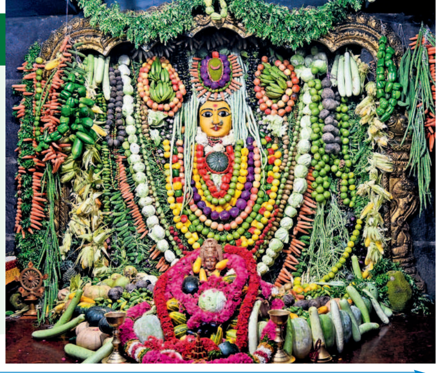
శాకంబరీ అలంకరణలో భద్రకాళీ అమ్మవారు