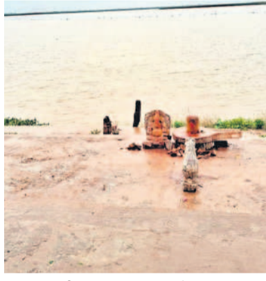
సంగమేశ్వరం ఆలయం వద్ద నీటి మట్టం

కొల్లూపూర్, జూలై 21 : కొల్లూపూర్ మండలం సోమలి వద్ద స్వచ్ఛమైన సంగమమైన సంగమేశ్వరం వద్ద కృష్ణమ్మ పరవళ్లు తొక్కుతున్నది. తుంగభద్ర, కృష్ణానదికి పెద్ద ఎత్తున వరద వస్తుండడంతో ఆదివారం కృష్ణానది జిల్లా లలితానామేశ్వర ఆలయం సమీపానికి చేరాయి. అయితే సంగమేశ్వరం ఆలయం జలమయం కానుండడంతో ఆరు నెలల వరకు పునఃదర్శనం ఉండదు. ఈ మేరకు శనివారం సాయంత్రం సంగమేశ్వరుడికి ప్రత్యేక పూజలు చేశారు. కృష్ణానదిలో వరద ఉధృతంగా ఉండడంతో నదీతీర ప్రాంతాల ప్రజలు, మత్స్యగారులు అప్రమత్తంగా ఉండాలని, నదీలోకి వెళ్లొద్దని అధికారులు హెచ్చరిస్తున్నారు.