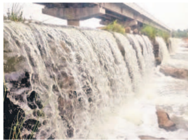
బండరీపల్లి చెక్ డ్యాం వద్ద ప్రవహిస్తున్న నీరు

అలుగుపారుతున్న బండరీపల్లి చెక్ డ్యాం దేవరకర్ణ, జూలై 21 : జిల్లాలోని భారీ నీటిపారుదల ప్రాజెక్టు అయిన కోయిల్ సాగర్ లో రోజూ రోజూకూ నీటి మట్టం పెరుగుతున్నది. ప్రాజెక్టుకు ఎగువ ప్రాంతంలో భారీ వర్షాలు కురుస్తుండడంతో ప్రాజెక్టులోకి వరద చేరుతుండడంతో ఆదివారం సాయంత్రానికి ప్రాజెక్టులో 17.5 ఫీట్లకు చేరిందని అధికారులు తెలిపారు. కోయిల్ సాగర్ ప్రాజెక్టు పూర్తిస్థాయి నీటిమట్టం 32.5 ఫీట్లు, మరో 15 ఫీట్ల మేర ప్రాజెక్టులోకి నీరు వస్తే గేట్లు తెరిచే అవకాశం ఉన్నది. అదేవిధంగా గూరకొండ-బండరీపల్లి మధ్యనున్న ఊకచెట్టి వాగులో నిర్మించిన చెక్ డ్యాం నీటి అలుగు పారుతుండడంతో సందర్భకులను ఆకట్టుకుంటున్నది.