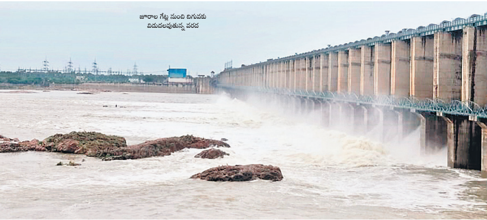
జూరాల గేట్ల సుంచి దిగువకు విడుదలవుతున్న వరద