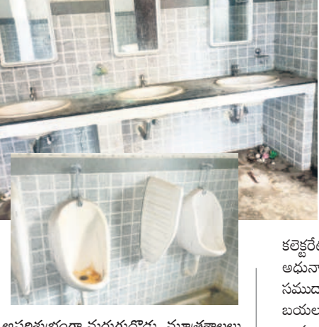
అపరిశుభ్రంగా మరుగుదొడ్లు, మూత్రశాలలు