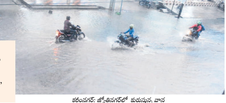
కరీంనగర్: జ్యోతిసగల్లో కురుస్తున్న వాన