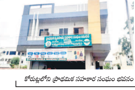
కోర్టులోని ప్రాథమిక సహకార సంఘం భవనం

కోర్టు/ కోర్టుల రూరల్, జూలై 20: కోర్టు మండలంలోని ఆరు సంఘాల పరిధిలో సగంమందికి రుణమాఫీ అంద లేదు. కోర్టు ప్రాథమిక సహకార సంఘంలో రూ.లక్షలోపు లోన్లు తీసుకున్నవారు 671 మంది ఉండగా, 250 మందికి మాత్రమే మాఫీ జరిగింది. ఎఫ్.ఎస్.ఎల్.లో 681 మందికిగాను 189 మందికి, మాదాపూర్ సంఘంలో 628 మందికిగాను 137 మందికి, పైడిమడుగులో 849 మందికిగాను 136 మందికి, చిన్నమెట్లపల్లిలో 640 మందికిగాను 269 మందికి, అయిలాపూర్ సంఘంలో 429 మందికిగాను కేవలం 108 మందికి మాత్రమే మాఫీ జరిగింది. మొత్తంగా 3896 మంది లోన్ తీసుకుంటే 1078 మందికి రద్దు కాగా, మిగిలిన 2818 మంది ఆందోళన చెందుతున్నారు.