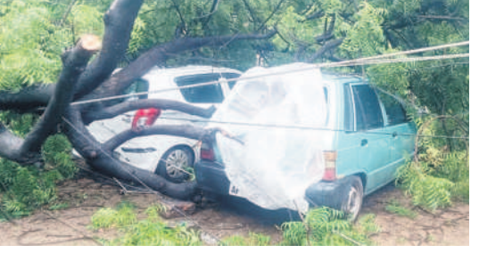
కరీంనగర్: చైతన్యపుల ప్రాంతంలో కాన్వెట్ విరిగిన పడిన చెట్టు

కరీంనగర్, జూలై 21 (నమస్తే తెలంగాణ): అల్పపీడన ప్రభావంతో కరీం గర్ ఉమ్మడి జిల్లాలో మూడు రోజులుగా విస్తారంగా వర్షాలు కురుస్తూనే ఉన్నాయి. శనివారం సాయంత్రం నుంచి తెరిసి లేకుండా పడుతుండగా వాగులు, వంకలు పొంగుతున్నాయి. కుంటులు, చెరువుల్లోకి వరద నీరు చేరు తుండగా, మత్తళ్లు పడుతున్నాయి. కరీంనగర్ జిల్లా హుజూరాబాద్ లోని చిలుక వాగు శనివారం రాత్రి కుంతే పొంగి పొర్లుతోంది. వాగు పరిసరాల్లోని కొన్ని గ్రామాల్లో పంటలు నీల మునిగాయి. శంకరపట్నం మండల కేంద్రం కేకవపట్నంలోని వాగులో వరద ఉధృతంగా వస్తోంది. జగిత్యాల జిల్లాలో వర్షం దంచి కొట్టింది. కొడిమ్యాల మండలం పాతారం రిజర్వాయర్, కోనాపూర్ లోని బంజరు చెరువు మత్తళ్లు పడుతున్నాయి. కొడిమ్యాల నుండి సూరంపేట వైపు దారిలో కోనాపూర్ శివారులో మాటుకుంట కట్టుకోతకు గురి కావడంతో కోర్టుల నుంచి కరీంనగర్ వైపు అధిగారులు నిలిపివేశారు. వేములవాడ మూలవారు జలకళ అంతంయకుంది. పట్టణంలో బతుకమ్మ తెప్ప వద్ద చెక్ డ్యాము మత్తడి దూకగా సోపానార్ కు వెళ్లెందుకు మూలవారులో వేసిన రహ దారి కొట్టుకుపోయింది.