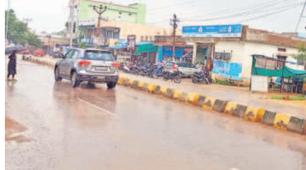
శివ్వంపేటలో కురుస్తున్న వర్షం