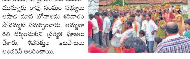
నిజాంపేట, జూలై 20: నిజాంపేటలో మున్నూరు కాపు సంఘం సభ్యులు ఆవిష్కరణ చేసిన బోనాలను శనివారం పాఠశాలకు సమర్పించారు. అమ్మవారిని దర్శించుకుని ప్రత్యేక పూజలు చేశారు. శివపత్తుల ఆటపాటలు అందరినీ ఆలరించాయి.