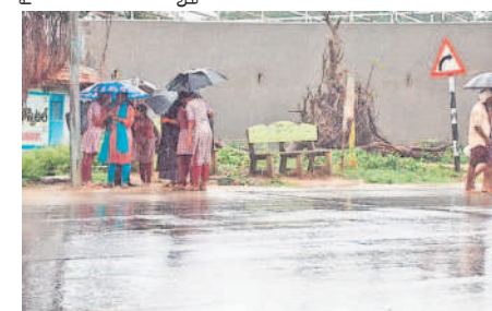
విస్తృత పర్యటన: బస్సుకోసం నిలబడ్డ విద్యార్థులు

విస్తృత పర్యటన, జూలై 20: మండలంలోని వివిధ గ్రామాల్లో శుక్రవారం రాత్రి నుంచి వందలాది లెంబులు ముసురు వర్షం కురుస్తున్నది. దీంతో పొలం పనులు జోరందుకున్నాయి. శివ్వంపేట మండలంలో 4.6 మి.మీ వర్షపాతం నమోదు శివ్వంపేట, జూలై 20: మండల వ్యాప్తంగా శనివారం ఉదయం నుంచి సాయంత్రం వరకు వర్షం కురిసింది. మండల వ్యాప్తంగా 4.6 మి.మీ వర్షపాతం నమోదైనది రెవెన్యూ అధికారులు తెలిపారు. ఏకదాటిగా వర్షం కురియడంతో మండల రైతులు ఆనందం వ్యక్తం చేశారు.