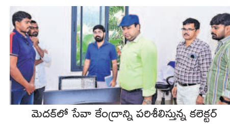
మెడక్లో సేవా కేంద్రాన్ని పరిశీలిస్తున్న కలెక్టర్

మెడక్ మున్సిపాలిటీ, జూలై 20: వృత్తి నైపుణ్యాలను యువత సద్వినియోగం చేసుకుంటే భవిష్యత్తుకు భరోసా చేసుకుంటుందని కలెక్టర్ అన్నారు. కలెక్టరేట్ సమావేశ మందిరంలో జిల్లా యువజన క్రీడల శాఖ అధ్యక్షులు వృత్తి నైపుణ్య శిక్షణ కేంద్రంలో వివిధ కోర్సుల్లో శిక్షణ పూర్తి చేసుకున్న యువతకు