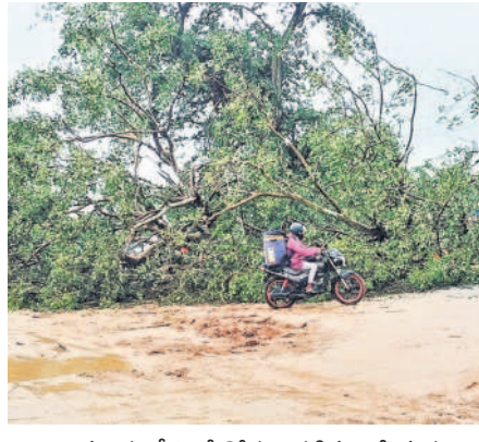
రామాయంపేటలో రోడ్డుపై పడిన ఖాళీ వృక్షం