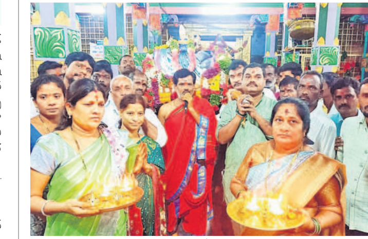
ఏడుపాయల్లో దుర్గామాత పల్లకి సేవ నిర్వహిస్తున్న భక్తులు

పాపస్వేప, జూలై 20: ముసురేసిన వర్షం లోనూ వన దుర్గామాత పల్లకి సేవ నిర్వహించారు. అనంతరం ఉత్సవ వైభవాన్ని అలంకరించిన గురుపౌర్ణిమ పురస్కరించుకుని శనివారం రాత్రి ఏడుపాయల దుర్గామాత పల్లకి సేవ నిర్వహించారు. అర్చకులు, ఏడుపాయల వారి పల్లకిని మోశారు.