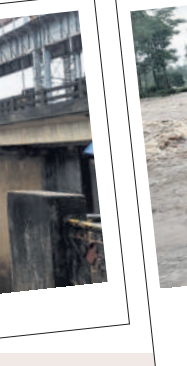
వర్షాల: పెద్ద గుళ్లలమంచి వాగు పొంగడంతో దరంపేట వద్ద ఉధృతంగా ప్రవాహాన్ని వాగు