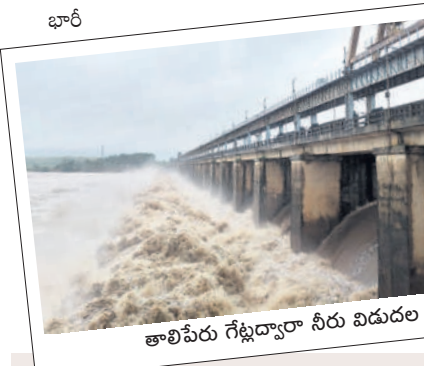
రాకపోకలకు అంతరాయం.. భారీ