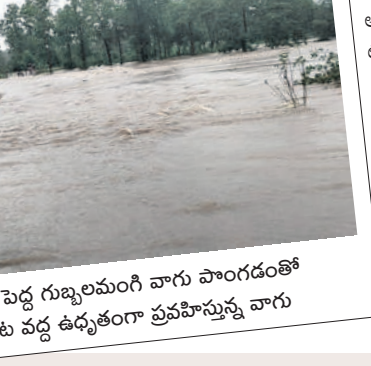
పల్లాల: పెద్ద గుళ్లలమంచి వాగు పొంగడంతో దరంపేట వద్ద ఉధృతంగా ప్రవాహాన్ని వాగు

వర్షాల కారణంగా భద్రాచలం డివిజన్ పరిధిలోని దుమ్మగూడెం, చర్ల మండలాల్లో గ్రామాలకు రాకపోకలు నిలిచిపోయాయి. దుమ్మగూడెం మండలంలో గుళ్లలమంచి వాగు పొంగి ప్రవహించడంతో కే లక్ష్మీపురం-పెదనల్లబల్లి గ్రామాలకు రాకపోకలు నిలిచిపోయాయి. దిగువన ఉన్న గ్రామాల సంగ్రం, నల్లబల్లి, గోరారం, పైడిగూడెం, తాలివారిగూడెం, సంజనాపురం మధ్య రాకపోకలు నిలిచిపోయాయి.