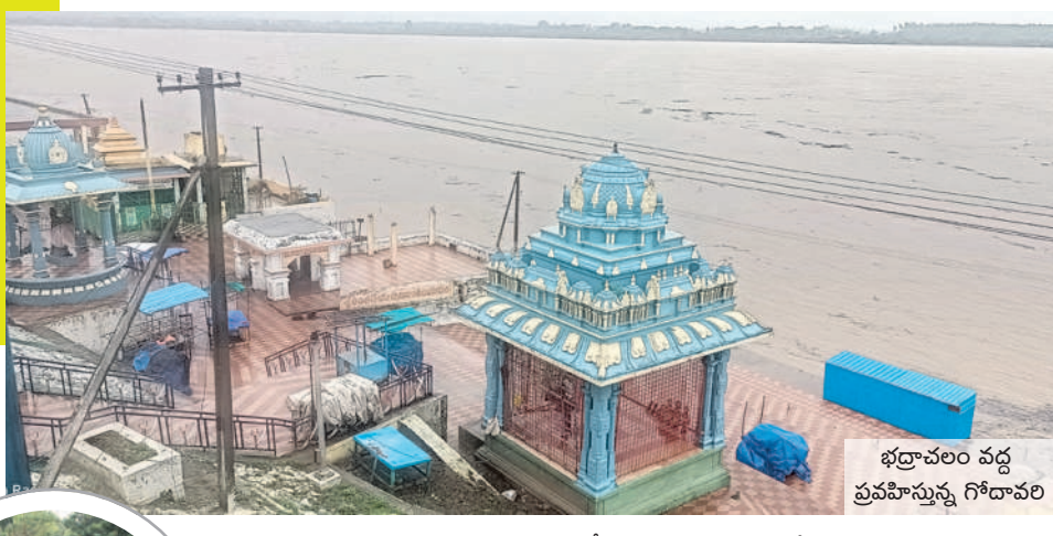
భద్రాచలం వద్ద ప్రవాహాన్ని గోదావరి

భద్రాద్రి కొత్తగూడెం, జూలై 20 : (నమస్తే తెలంగాణ) : కొద్దిరోజులగా కురుస్తున్న వర్షాల కారణంగా భద్రాద్రి కొత్తగూడెం జిల్లాలో వాగులు పొంగి ప్రవహిస్తున్నాయి. భద్రాచలం వద్ద గోదావరిలో వరద క్రమేపే పెరుగుతున్నది. కిన్నెరసానిలో భారీగా వరద వేరడంతో 15 వేల క్యూసెక్కుల నీటిని బయటకు వదలిపెట్టారు. చర్ల మండలం తాలిపేరు ప్రాజెక్టు నుంచి 1.45 లక్షల క్యూసెక్కుల నీటిని వదులుతున్నారు. మొత్తం గేట్లు ఓపెన్ చేయడంతో దిగువ భాగంలో వరద ఉధృతంగా ప్రవహిస్తున్నది. గుంపల్లి - చర్ల గ్రామాల మధ్య రాకపోకలకు అంతరాయం కలిగింది. పల్లాలలో సీతమ్మ నారదేవిల ప్రదేశం నీటి మునిగింది.