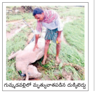
గుమ్మడపల్లిలో మృత్యువాతపడిన దుక్కబిడ్డ

ఈ ఏడాది పంటలు ప్రశ్నార్థకమే..? గుమ్మడపల్లి, కొత్తూరు, నారాయణపురం గ్రామాల్లోని రైతులు పరినాట్లు వేసినందుకు దుక్కులు దున్ని సిద్ధం చేసుకున్నారు. ఈలోపే వరదల కారణంగా భూముల్లో ఇసుకమేటలు వేశాయి. దీంతో ఈ ఏడాది టీడు భూములు లూగా మిగులుతాయని రైతులు ఆందోళన చెందుతున్నారు. ఇసుకను తోలగించటం, గుంతలను పూడ్చటం వంటి పనులు చేపడితే వరదలను రూ.50 వేల నుంచి లక్షల పైగా ఖర్చు అవుతుందని, దీనికి ప్రభుత్వం సాయం అందించాలని వేడుకుంటున్నారు.