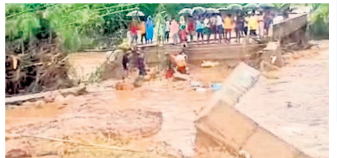
కావడిగుండ్ల-కన్నాయిగూడెం రహదారిలో కొట్టుకుపోయిన బ్రిడ్జి పైకెక్కు

అశ్వారావుపేట రూరల్, జూలై 20 : ప్రభావంతో కొద్దిరోజులగా కురుస్తున్న వర్షాల కారణంగా అశ్వారావుపేట మండలం అగం.. ఆగం అయ్యింది. వరుణుడి ప్రతాపంతో ముఖ్యంగా గుమ్మడపల్లి, బహువారి గూడెం, రంగాపురం, అనంతారం, నారాయణపురం గ్రామ పంచాయతీల్లోని రైతులకు కొండంత శోకం మిగిలింది. వేలాది మంది రైతులకు కడుపు నింపే వరప్రదాయిని, అన్నపూర్ణ లాంటి పెదవాగు ప్రాజెక్టు రూపమే మారి పోయింది. ఇటీవలే ప్రాజెక్టు మరమ్మత్తు కోసం గత ప్రభుత్వం విడుదల చేసిన రూ.కోటి 20లక్షల నిధులు నీటిపాల్ అయ్యాయి. ఎటువంటి పత్తి, వరి, కూరగాయలు, పొవ్వూరి వంటి పంటలు ఇసుక మేటలతో దగ్ధమవుతున్నాయి. వ్యవసాయ క్షేత్రాలకు రైతులు వెనుకబడ్డారు. ఏడు నెలల పాటు ముక్కలు ముక్కలుగా విరిగిపోయాయి. ట్రాన్స్ఫార్మర్లకు వరదల కొట్టుకుపోయాయి. వారులు పొంగిపోతున్నాయి. రహదారులు చిద్రంగా మారాయి.. పలుచోట్ల గుండ్ల పడ్డాయి. మూగజీ వారు కొట్టుకుపోయాయి. ప్రజలంతా మూడో రోజు