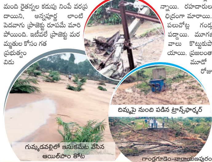
గుమ్మడపల్లిలో ఇసుకమేట వేసిన అయిదోం తోట

అశ్వారావుపేట రూరల్, జూలై 20 : ప్రభావంతో కొద్దిరోజులగా కురుస్తున్న వర్షాల కారణంగా అశ్వారావుపేట మండలం అగం.. ఆగం అయ్యింది. వరుణుడి ప్రతాపంతో ముఖ్యంగా గుమ్మడపల్లి, బహువారి గూడెం, రంగాపురం, అనంతారం, నారాయణపురం గ్రామ పంచాయతీల్లోని రైతులకు కొండంత శోకం మిగిలింది. వేలాది మంది రైతులకు కడుపు నింపే వరప్రదాయిని, అన్నపూర్ణ లాంటి పెదవాగు ప్రాజెక్టు రూపమే మారి పోయింది. ఇటీవలే ప్రాజెక్టు మరమ్మత్తు కోసం గత ప్రభుత్వం విడుదల చేసిన రూ.కోటి 20లక్షల నిధులు నీటిపాల్ అయ్యాయి. ఎటువంటి పత్తి, వరి, కూరగాయలు, పొవ్వూరి వంటి పంటలు ఇసుక మేటలతో దగ్ధమవుతున్నాయి. వ్యవసాయ క్షేత్రాలకు రైతులు వెనుకబడ్డారు. ఏడు నెలల పాటు ముక్కలు ముక్కలుగా విరిగిపోయాయి. ట్రాన్స్ఫార్మర్లకు వరదల కొట్టుకుపోయాయి. వారులు పొంగిపోతున్నాయి. రహదారులు చిద్రంగా మారాయి.. పలుచోట్ల గుండ్ల పడ్డాయి. మూగజీ వారు కొట్టుకుపోయాయి. ప్రజలంతా మూడో రోజు