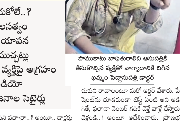
పాముకాటు బాధితురాలిని ఆసుపత్రికి తీసుకొచ్చిన వ్యక్తితో వ్యాధిదానిని దిగిన ఖమ్మం పెద్దాసుపత్రి డాక్టర్

యా. వారి దగ్గరకు వెళ్లిన రైతు, తమ రాయింపకుని వచ్చా..? అంటూ.. డాక్టర్లు గ్రామానికి చెందిన మహిళా పాము కాటుకు గురైంది, వచ్చి చూడాలని ప్రాధేయపడ్డారు. వైద్యుల తీవ్ర నిర్లక్ష్య ధోరణి 'ఏం పాము కరిచింది..? ఎక్కడ కాటు వేసింది..? ఏ ఉడు..? ఏ మండలం..? ఓపీ రాయింపకుని వచ్చా..? అంటూ.. డాక్టర్లు గ్రామానికి చెందిన మహిళా పాము కాటుకు గురైంది, వచ్చి చూడాలని ప్రాధేయపడ్డారు. వైద్యుల తీవ్ర నిర్లక్ష్య ధోరణి 'ఏం పాము కరిచింది..? ఎక్కడ కాటు వేసింది..? ఏ ఉడు..? ఏ మండలం..? ఓపీ రాయింపకుని వచ్చా..? అంటూ.. డాక్టర్లు గ్రామానికి చెందిన మహిళా పాము కాటుకు గురైంది, వచ్చి చూడాలని ప్రాధేయపడ్డారు. వైద్యుల తీవ్ర నిర్లక్ష్య ధోరణి 'ఏం పాము కరిచింది..? ఎక్కడ కాటు వేసింది..? ఏ ఉడు..? ఏ మండలం..? ఓపీ రాయింపకుని వచ్చా..? అంటూ.. డాక్టర్లు గ్రామానికి చెందిన మహిళా పాము కాటుకు గురైంది, వచ్చి చూడాలని ప్రాధేయపడ్డారు. వైద్యుల తీవ్ర నిర్లక్ష్య ధోరణి 'ఏం పాము కరిచింది..? ఎక్కడ కాటు వేసింది..? ఏ ఉడు..? ఏ మండలం..? ఓపీ రాయింపకుని వచ్చా..? అంటూ.. డాక్టర్లు గ్రామానికి చెందిన మహిళా పాము కాటుకు గురైంది, వచ్చి చూడాలని ప్రాధేయపడ్డారు.