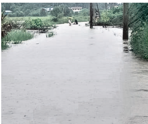
దుమ్మగూడెం మండలంలో సున్నంబట్టి-వరదల వల్ల గ్రామాల మధ్య రాకపోకలకు అంతరాయం