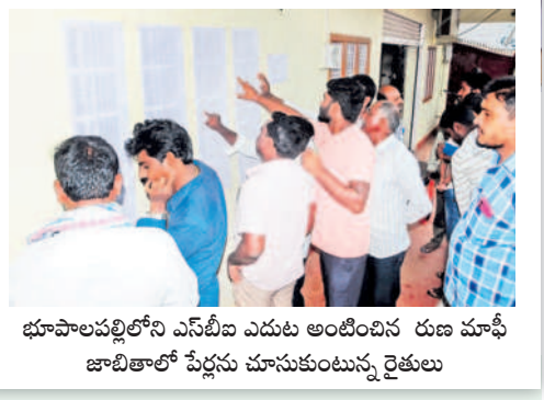
భూపాలపల్లిలోని ఏసీబీని ఎదురు అంటించిన రుణ మాఫీ జాబితాలో పేర్లు చూసుకుంటున్న రైతులు

వరంగల్, జూలై 19 (నమస్తే తెలంగాణ ప్రతినిధి) : రైతులకు రుణ మాఫీ రంది పట్టుకున్నది. లోన్ మాఫీ అయిందా? కాలేదా? అనే స్పష్టత లేకపోవడంతో ఏం చేయాలి అర్థంకాక తలలు పట్టుకున్నారు. గురువారం సాయంత్రం నుంచి ఈ ఉత్కంఠ ఇలాగే కొనసాగుతుండగా శుక్రవారం ఉదయం పాస్ బుక్లతో బ్యాంకులకు పరుగులు తీశారు. అక్కడ ఆరా తీసినా వివరాలు తెలియకపోవడంతో నిరాశతో ఇంటిబాట పట్టారు. కాంగ్రెస్ ప్రభుత్వం లక్ష రూపాయల వరకు పంట రుణాలను మాఫీ చేసినట్లు ప్రకటించినా ఇప్పటికీ వీటిపై రైతులో అయోమయం నెలకొన్నది. రుణ మాఫీ ప్రకటన జరిగి 24 గంటలు గడిచినా తాము తీసుకున్న లోన్లు ఏమయ్యాయో వారికి అంతుచిక్కడంలేదు. రుణ మాఫీపై స్పష్టత కోసం భారీ సంఖ్యలో రైతులు బ్యాంకులకు వెళ్లి ఆరా తీస్తున్నారు. బ్యాంకుల నుంచి దీనిపై సరైన సమాధానం రావడంలేదు. గ్రామాల వారిగా గానీ, బ్యాంకుల వారిగా గానీ లోన్లు మాఫీ అయిన వారి పేర్లు జాబితా అందుబాటులో లేక అందరూ ఇదే పరిస్థితి ఎదుర్కొంటున్నారు. కాంగ్రెస్ ప్రభుత్వం రేపన్ కార్డు నిబంధన పెట్టడం వల్ల తమ రుణాలు ఏమయ్యాయోనని రైతులు అందోళన చెందుతున్నారు. కుటుంబంలో ఒక్కరికే లోన్ మాఫీ అనడంతో ఎవరెవరికి మాఫీ అయ్యాయో తెలియడం లేదు. అప్పటినుంచి రైతులు తమ సెల్ ఫోన్లను చూసుకుంటున్నారు. లోన్ ను సరేపదా మొత్తాన్ని రాష్ట్ర ప్రభుత్వం