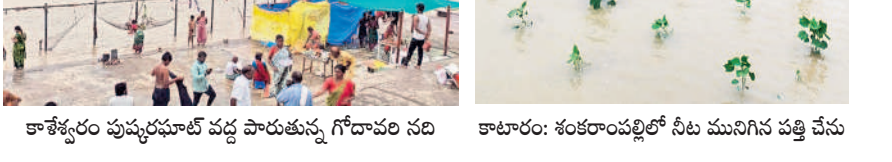
కాటారం: శంకరాంపల్లిలో నీటి మునిగిన పత్తి చేసు