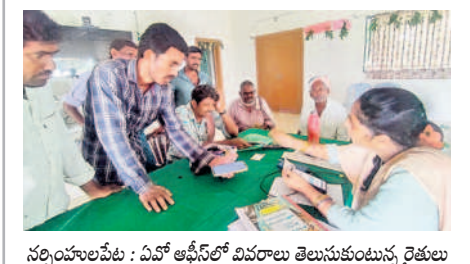
సర్పంచులపేట : ఏవో టేబుల్ వివరాలు తెలుసుకుంటున్న రైతులు

ములుగు డి.వి.జి. విజయచంద్ర వెల్లడి ములుగు, జూలై 19 (నమస్తే తెలంగాణ) : సాక్షి తిక సమస్యతో పాటు ఇతర కారణాల వల్ల రుణ మాఫీ జాబితాలో పేర్లు లేని రైతులు మండలకేంద్రాల్లో ఏర్పాటుచేసిన గ్రీవెన్స్ లో ఫిర్యాదు చేస్తే రుణమాఫీకి సంబంధించిన సమస్యలను పరిష్కరిస్తామని ములుగు జిల్లా వ్యవసాయ శాఖ అధికారి విజయచంద్ర ఒక ప్రకటనలో తెలిపారు. గ్రీవెన్స్ లో మండల వ్యవసాయ శాఖ అధికారితో పాటు కిందిస్థాయి సిబ్బందికి విధులు కేటాయించినట్లు పేర్కొన్నారు. అలాగే కలెక్టరేట్లోనూ ప్రత్యేకంగా గ్రీవెన్స్ లో ఏర్పాటు చేశామని, రుణమాఫీ జాబితాలో పేర్లు లేని అర్హులైన రైతులు ఎవరైనా ఉంటే గ్రీవెన్స్ లో ఫిర్యాదు చేయవచ్చని తెలిపారు. ఫిర్యాదుల ఆధారంగా చర్యలు తీసుకొని రాష్ట్ర ప్రభుత్వం ప్రకటించిన రుణమాఫీని అర్హులైన ప్రతి రైతుకు పరిష్కరిస్తామని డిఎస్ చెప్పారు.