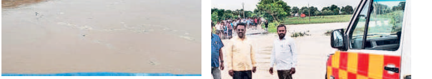
వాజేడు : పూసూరు బ్రిడ్జి వద్ద ఉద్ధృతంగా గోదావరి