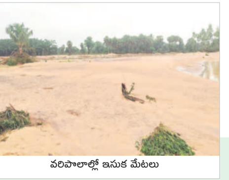
వరిపాలాల్లో ఇసుక మేటలు

అందకారంలో ఉన్నాయి. మరోవైపు తాగునీటి కోసం ప్రజలు అల్లాడుతున్నారు. నాయకులవారం - గుమ్మడపల్లి మార్గంలో సుమారు 50కి పైగా విద్యుత్ స్తంభాలు కూలిపడ్డాయి. గుమ్మడపల్లిలోని 50 నివాసాల్లోని వరదనీరు చేరింది. వారంతా జిల్లావారి గూడెంలో పెదవాగు ప్రాజెక్టు భవనాల్లో తలదాచుకున్నారు.