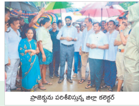
ప్రాజెక్టును పరిశీలిస్తున్న జిల్లా కలెక్టర్