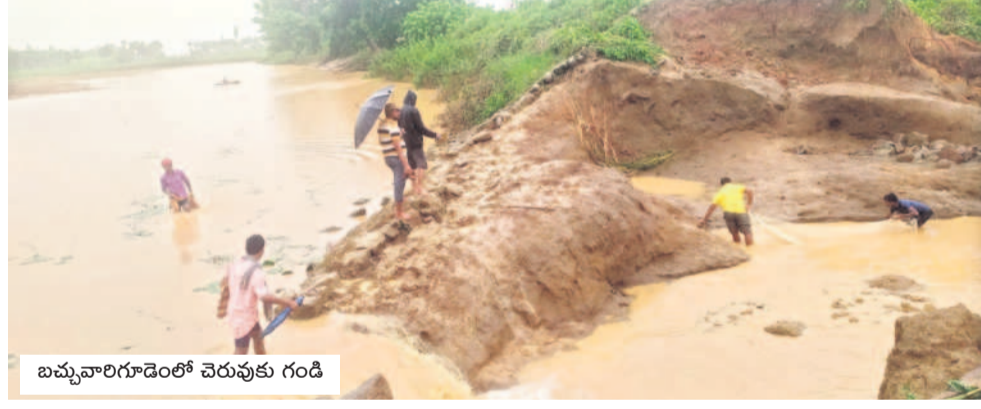
బమ్మవారిగూడెంలో చెరువుకు గండి

ఉన్న కొండల నుంచి వచ్చే వర్షపు నీరే ఆధారం. అప్పటి నుంచి ఇప్పటి వరకూ ఇక్కడి రైతులు ఈ ప్రాజెక్టు కింద రెండు పంటలు సాగు చేసుకుంటున్నారు. 1984లో ఈ ప్రాజెక్టుకు ఒకసారి గండి పడింది. ఇప్పుడు కూడా అదే ప్రాంతంలో తిరిగి గండి పడింది. 2014లో రాష్ట్ర విభజన తరువాత అశ్వారావుపేట మండలంలోని గుమ్మడపల్లి, కొత్తూరు గ్రామాల రైతులు దీని కింద 2,380 ఎకరాల సాగు చేస్తున్నారు. ఏపీలోని విలీనమైన వేలేపాడు, కుకు నూరు మండలాల రైతులు 14 వేల ఎకరాల్లో పంటలు సాగు చేసుకుంటున్నారు. ఏపీలోని విలీనమైన వేలేపాడు, కుకు నూరు మండలాల రైతులు 14 వేల ఎకరాల్లో పంటలు సాగు చేస్తున్నారు. ఏపీలోని విలీనమైన వేలేపాడు, కుకు నూరు మండలాల రైతులు 14 వేల ఎకరాల్లో పంటలు సాగు చేస్తున్నారు. ఏపీలోని విలీనమైన వేలేపాడు, కుకు నూరు మండలాల రైతులు 14 వేల ఎకరాల్లో పంటలు సాగు చేస్తున్నారు.