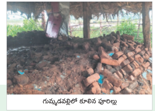
గుమ్మడపల్లిలో కూలిన పూలల్లు