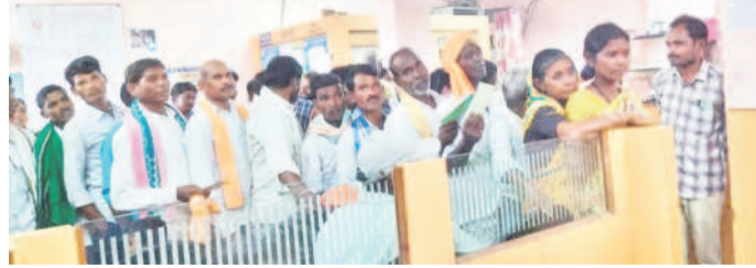
సింకొండలోని బ్యాంకులో క్యూలో నిలబడిన రైతులు