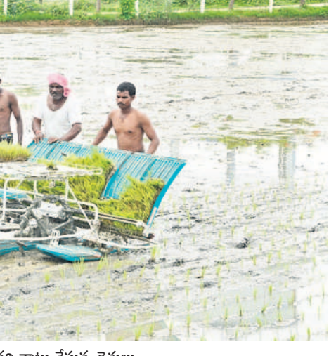
కోడూరులో ట్రాన్స్ ఫార్మాటర్ మిషన్ తో పని నాట్లు వేస్తున్న రైతులు