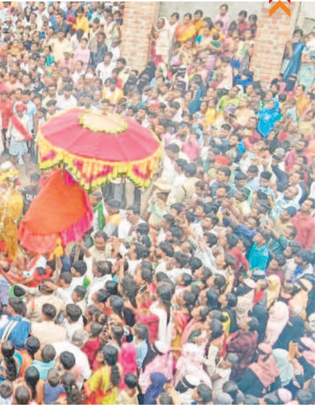
ఊటూర్లో హుసన్, హుస్సేన్ పీర్ల సవారి వేడుకల్లో పాల్గొన్న భక్తులు