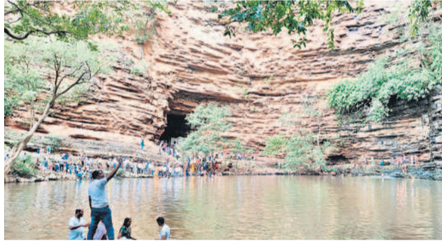
లొద్దిమల్లయ్య ఆలయం వద్ద గుండంలో స్నానాలు ఆచరిస్తున్న భక్తులు

భక్తులు ఆందోళనతో అనుమతిచ్చిన అటవీశాఖ అధికారులు అనంతరం, జూలై 17 : నల్లమలలోని లొద్దిమల్లయ్య క్షేత్రాన్ని బుద్దవారం భక్తులు దర్శించుకోవాలి పూజలు నిర్వహించారు. తొలి ఏకాదశిని పురస్కరించుకుని అటవీశాఖ విధించిన ఆంక్షల మధ్య స్థానిక భక్తులు తాలినడకతో వెళ్లి స్వామి వారిని దర్శించుకున్నారు. బాణాల, చౌలపల్లి మీదగా తాలినడకతో వెళ్లి భక్తులు లొద్దిమల్లయ్యను చేరుకోవాలి పూజలు చేశారు. మన్నూర్ మీదగా వెళ్లిన భక్తులను అటవీశాఖ అధికారులు మార్గమధ్యంలో నిలిపివేయడంతో శ్రీశైలం-వైడారాబాద్ రోడ్డుపై బైరాయిని ఆందోళన చేశారు. దాదాపు 2 గంటల పాటు ఆందోళన చేయగా చివరికి అటవీశాఖ అధికారులు అనుమతి ఇచ్చారు. ఏడాదికి ఒక్కసారి తొలి ఏకాదశి రోజు దర్శనమిచ్చే లొద్దిమల్లయ్యను పూజించాలని భక్తులు ఎంతో ఎదురుమాడగా అటవీ శాఖ అధికారులు నిబంధనల పేరుతో స్వామి వారిని దర్శించుకోవాలి మెనుబాటును ఇవ్వకపోవడంతో భక్తులు ఆందోళనకు గురయ్యారు. ఒక రోజు మాత్రమే అనుమతి ఇవ్వగా భక్తులు గుండంలో స్నానాలు ఆచరించి స్వామి వారిని దర్శించుకోని ప్రత్యేక పూజలు చేశారు. అయితే ప్యాస్టిక్ కవర్లు, వాటి బాటిళ్లను సేదించడంతో భక్తులు తాగునీటికి ఇబ్బందులు పడ్డారు.