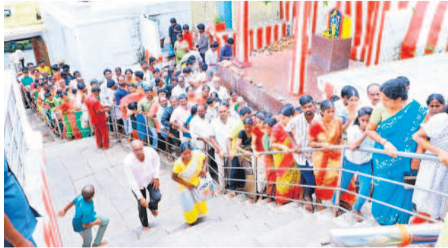
మన్యంకొండ వెంకన్న దర్శనానికి కూర్చో నిల్చున్న భక్తులు