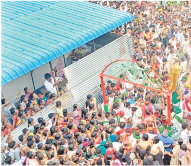
ఊటూర్లో హుసన్, హుస్సేన్ పీర్ల సవారి వేడుకల్లో పాల్గొన్న భక్తులు

ఊటూర్, జూలై 17 : యుద్ధంలో వీర మరణం పొందిన మహ్యద్రి ప్రవక్త మనుమలు ఇమామ్ హుసన్, ఇమామ్ హుసన్ స్మార్ట్ థ్యాంకస్ గుర్తింపుగా జరుపుకోనే మొహర్రం (పీర్ల పండుగ) వేడుకలకు బుద్దవారం కర్ణాటక, మహారాష్ట్రతో పాటు పలు పట్టణాలు, పరిసర గ్రామాల నుంచి భక్తులు పెద్ద సంఖ్యలో హాజరయ్యారు. వేలాది మంది భక్తులు రాకతో ఊటూర్ మండలకేంద్రంలోని హుసన్, హుస్సేన్ పీర్ల వావిడి జనసంద్రంగా మారింది. భక్తులు చక్కెర, పుట్టాలు, గోధుమ పిండితో నైవేద్యం తయారు చేసి మొక్కుబడులు చెల్లించుకున్నారు. కొందరు భక్తులు గొర్రెలు, మేకలతో కందూర్లు నిర్వహించారు. నవమి, దశమి రోజులను ప్రత్యేక సంతాప దినాలుగా భావిస్తూ భక్తులు ఉపవాస దీక్షలను కొనసాగించారు.