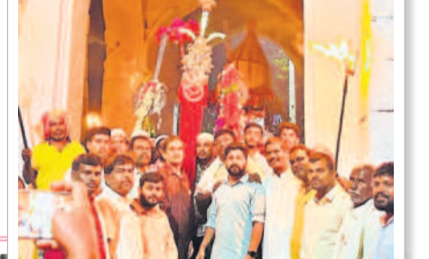
ఉత్సవాలకు భారీగా తరలివచ్చిన భక్తులు (ఇస్సెట్లో) కోట్ల నుంచి వస్తున్న బీబీ ఫాతిమా పీర్ల