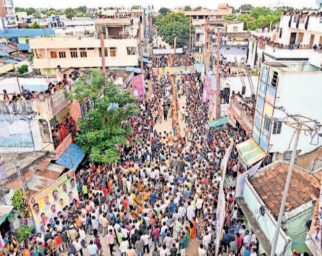
బీరన్న బోనాల సందర్భంగా కరీమాబాద్ బురుజు నింటిలో జన సందోహం