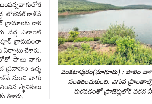
వెంకటాచలం(నూగుడి) : పాలెం వారు ప్రాజెక్టుకు జలకళను సంతరించుకుంది. ఎగువ ప్రాంతాల్లో భారీగా వర్షాలు కురువడంతో ప్రాజెక్టులోకి వరద నీరు చేరుతుంది.