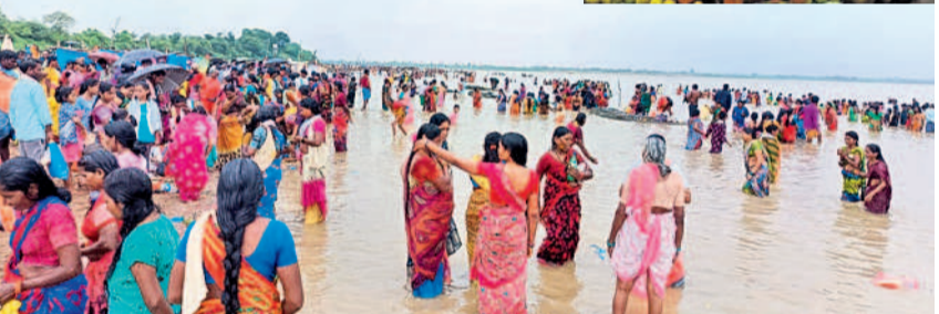
కాశ్యపం : త్రివేణి సంగమంలో పుణ్యస్నానాలాచరిస్తున్న భక్తులు