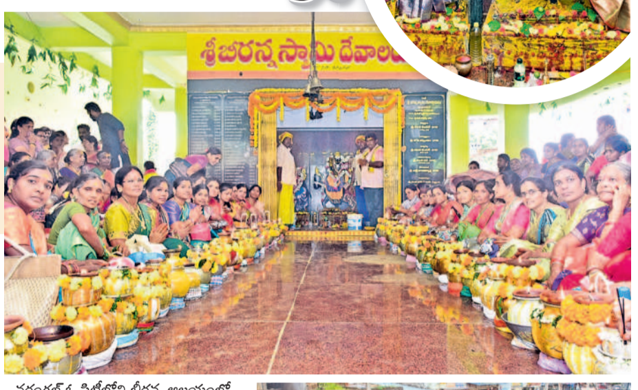
వరంగల్ ఓ సిటిలోని బీరన్న ఆలయంలో పూజలు చేస్తున్న మహిళలు (ఇన్సెట్లో) ఉత్సవ మూర్తులు