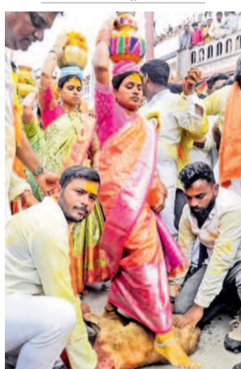
గాపు పట్టణ గొర్రెపై నుంచి దాటుతున్న మహిళ