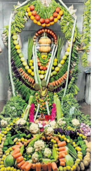
జనవోలు: కాకంబరి అలంకారంలో జనవోలు క్రమరూపిణిదావీ

ఉమ్మడి జిల్లా వ్యాప్తంగా వేడుకలు భక్తులతో కిటకిటలాడిన ఆలయాలు గోదావరిలో పుణ్యస్నానాలాచరించిన ప్రజలు నమస్తే నెట్వర్క్ : తొలి ఏకాదశి పర్యవేక్షణ ఉమ్మడి వరంగల్ జిల్లా ప్రజలు బుధవారం ఘనంగా జరుపుకున్నారు. ఉదయం నుంచే ఆలయాలకు చేరుకొని ప్రత్యేక పూజలు చేశారు. వరంగల్లోని భద్ర కాశీ, భూపాలపల్లి జిల్లాలోని కాశ్యపరంజీ పాట ఆయా మండలాల, గ్రామాల్లోని ఆలయాలు భక్తులతో కిటకిటలాడాయి. కాశ్యపరంజీని త్రివేణి సంగమంతోపాటు తీర ప్రాంతంలో ప్రజలు పుణ్య స్నానాలాచరించారు. భక్తులకు ఇబ్బందులు కలగకుండా అధికారులు ఏర్పాట్లు చేశారు. మహిళలు ఉపవాస దీక్షలు చేపట్టారు.