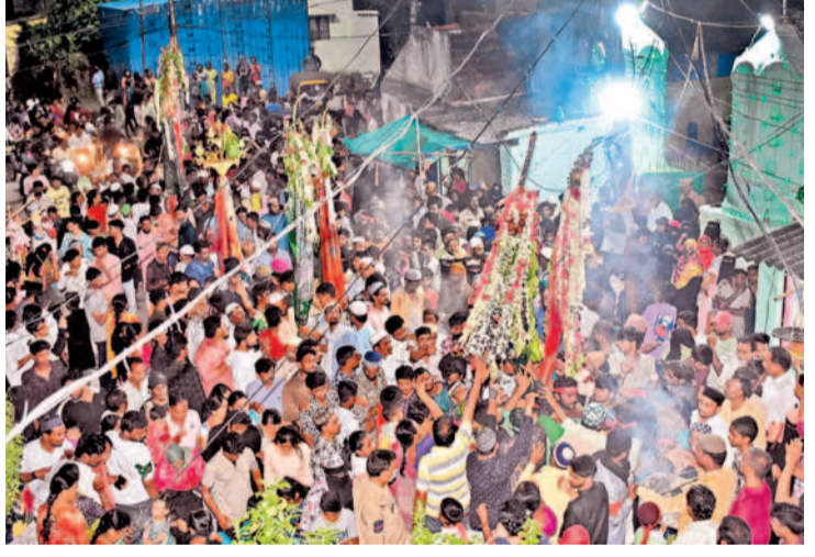
పీఠల శివరేగింపుతో కోలాహలంగా మారిన వరంగల్ కోట

మతసామరస్యానికి ప్రతీకగా నిలిచే మొహర్రం వేడుకలను బుధవారం ఉమ్మడి వరంగల్ జిల్లా ప్రజలు భక్తి శ్రద్ధలతో జరుపుకొన్నారు. ఆయా గ్రామాల్లో మజాహర్లు, శివసత్తులు పీఠలను పీఠుల్లో శివరేగించారు. ఈ సందర్భంగా భక్తులు మురుపులు చెల్లించి, కానుకలు సమర్పించారు. అగ్నిగుండ ప్రదర్శనలు చేపట్టారు. అనంతరం పీఠల నిమజ్జనం చేశారు.