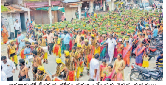
జనగామలో బీరన్నకు బోనం సమర్పించేందుకు వెళ్తున్న కురుమలు