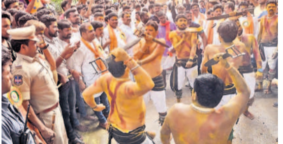
కరీమాబాద్లో పోతరాజుల విన్యాసాలు