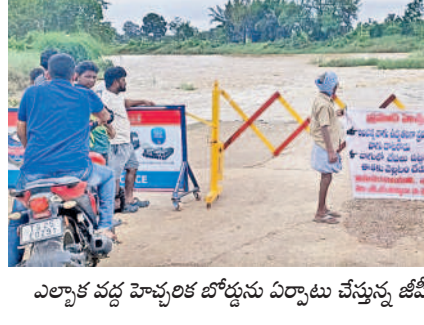
తాదాగ్లు, జూలై 17 : మండలంలోని మేడారం జంపన్నవారు వరద నీటితో ఉద్వేగంగా ప్రవహిస్తున్నది. బుధవారం తెల్లవారు జాము నుంచి కురుస్తున్న భారీ వర్షం కారణంగా జంపన్నవారులోకి వరద నీరు వేరడంతో ఎల్వక్క పద్మ లోతెలతో కాజీవే నీటి మునిగి ఎల్వక్క, పడిగూర్ల గ్రామాలకు రాకపోకలు నిలిచిపోయాయి. వారు వద్ద ఎలాంటి ప్రమాదాలు జరుగకుండా నారాహార్ గ్రామంపై యంత్ర సిబ్బంది హెచ్చరిక బోర్డులు ఏర్పాటు చేశారు. గ్రామానికి చెందిన ఓ వ్యక్తి ఆలోతో పాటు వారు దావోందుకు ప్రయత్నించగా వరద ప్రవాహం ఉద్వేగంగా ఉండడంతో లోతెలతో కాజీవే నుంచి వారు లోకి ఆలో పడిపోయింది. గమనించిన స్థానికులు వైపరతో పాటు ఆటోను బయటకు తీశారు.