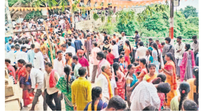
ఉమామహేశ్వర ఆలయానికి భారీగా తరలివచ్చిన భక్తులు