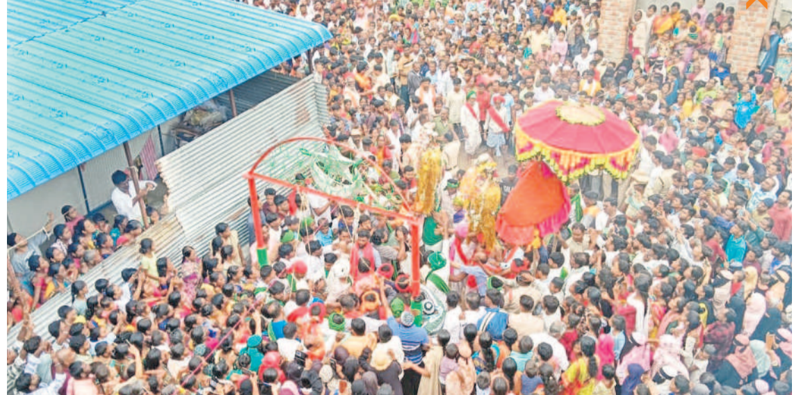
ఊటూర్లో హసన్, హుస్సేన్ పీఠ సవారీ వేడుకల్లో పాల్గొన్న భక్తులు