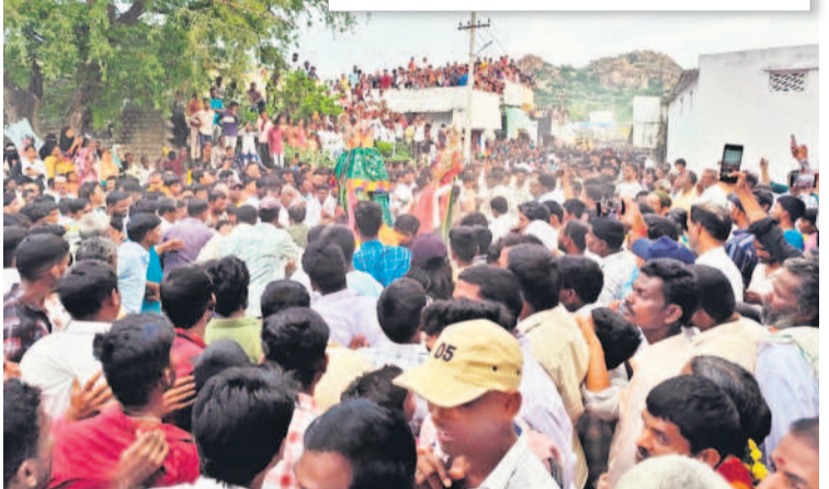
ఉత్సవాలకు భారీగా తరలివచ్చిన భక్తులు (ఇన్సెన్ట్) కోట్లపై నుంచి వస్తున్న బీబీ ఫాతిమా పీఠ

మహబూబ్ నగర్, జూలై 17 (నమస్తే తెలంగాణ ప్రతినిధి) : మొహర్రం ఉత్సవాల్లో భాగంగా కోయిలకొండలో తొమ్మిది రోజులుగా ప్రత్యేక పూజలందుకున్న బీబీ ఫాతిమా నిమజ్జనానికి భక్తులు వెలాదిగా తరలివచ్చారు. రాష్ట్రంలోనే ప్రసిద్ధిగాంచిన కోయిలకొండ మొహర్రం ఉత్సవాలు బుద్ధవారంతో ముగిసాయి. రాష్ట్ర నలుమూలల నుంచి వేలసంఖ్యలో భక్తులు కోయిలకొండ కోట్లపై వుదీరిన బీబీ ఫాతిమాను దర్శించుకొని కందూర్లు నిర్వహించి మొక్కులు చెల్లించుకున్నారు. అదేవిధంగా బీబీ ఫాతిమాకు సర్కారు నుంచి చక్కెరను సమర్పించారు. అనంతరం కోట్లపై నుంచి పీఠను కాగడాలు, వాయిద్యాలతో కోట్ల కింది వరకు తీసుకొచ్చారు. పాత పోలీస్ స్టేషన్ వద్ద ఏర్పాటు చేసిన అగ్నిగుండంలో భక్తులు నడవడం అం దరి నీ విశేషంగా ఆకట్టుకుంది. ఈ సందర్భంగా వివిధ ప్రాంతాల నుంచి వచ్చిన భక్తులు కోలాటాలు