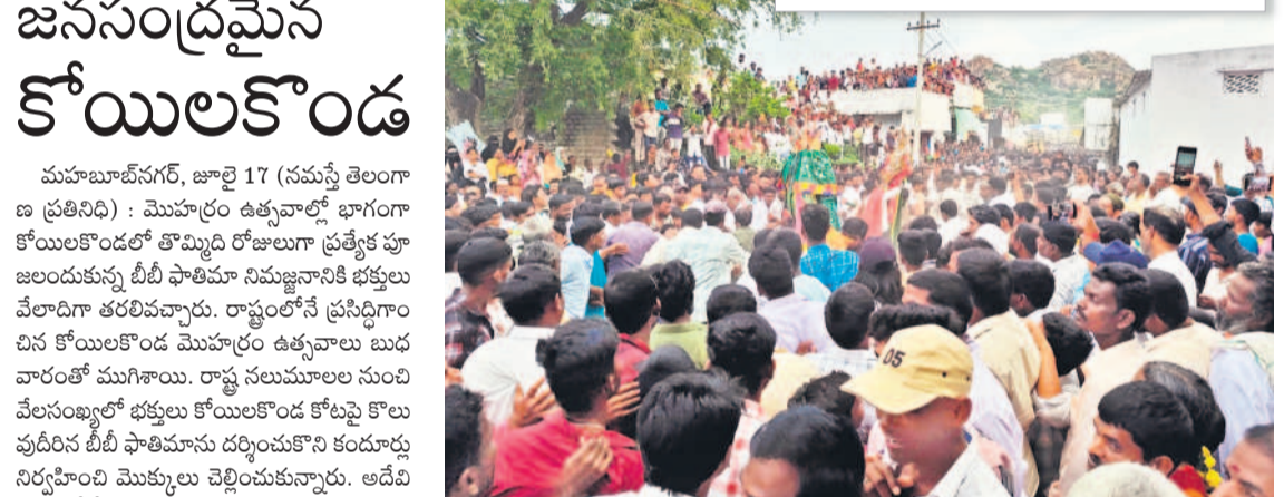
ఉత్సవాలకు భారీగా తరలివచ్చిన భక్తులు (ఇన్సెన్ట్) కోట్లపై నుంచి వస్తున్న బీబీ ఫాతిమా పీఠ

మొహర్రం పండుగను బుద్ధవారం ఉమ్మడి జిల్లాలోని ప్రజలు భక్తి శ్రద్ధలతో జరుపుకొన్నారు. పెద్ద ఎత్తున జరిగే కోయిలకొండ, ఊటూర్, తిమ్మజివెల జనసంద్రంగా మారాయి. లలాగే ఆయా గ్రామాల్లో పీఠ చావీడిలను దర్శించుకునేందుకు భక్తులు పోలితారు. మరీజా సిద్ధం చేసి పీఠకు నైవేద్యం సమర్పించారు. మొక్కుబడుల్లో భాగంగా కందూర్లు నిర్వహించారు. సవారీలు కనువిందు చేయగా.. లగ్నీ గుండంలో భక్తులు నడిచారు. యువకుల లలయ.. బలయ, మహిళల బొడ్డెమ్మలు ఆకట్టుకున్నాయి. అనంతరం నిమజ్జనంతో ఉత్సవాలు ముగిసాయి.