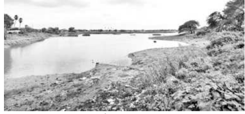
సగం కూడా నిండాని గేనుగొండ మండలం మొగిలిచర్లలోని పడమటి చెరువు

వరంగల్, జూలై 17 (నమస్తే తెలంగాణ): వరంగల్ జిల్లాలో ఈ ఏడాది వర్షాభావం పరిస్థితులు రైతులను కలవరపెడుతోంది. అనుష్ఠిత వర్షాలు లేక చెరువులు, కుంటలు అడుగంటగా ఇప్పటివరకు ఏ ఒక్క చెరువు, కుంటలోకి నీళ్లు తూము వరకు చేరింది లేదు. అయికట్టుకు సాగునీరు అందే పరిస్థితి లేకపోవడం రైతులను అందోళనకు గురిచేస్తోంది. వరి సాగుచేసే రైతులు వేసిన నారు ఎదిగినప్పటికీ నాలు వేసినందుకు సాగునీరు లేదు. ఇక పత్తి రైతులు ఇప్పటికే 26.94కు 24.48, దుగ్గొండలో 26.94కు 24.48 సెం.మీ.లుగా నమోదైంది. ఇక జిల్లాలో 326 బడి భారం పడతోంది. వరంగల్ జిల్లా అంతటా ఇదే పరిస్థితి ఉండగా కొన్ని మండలాల్లో సాధారణ వర్ష