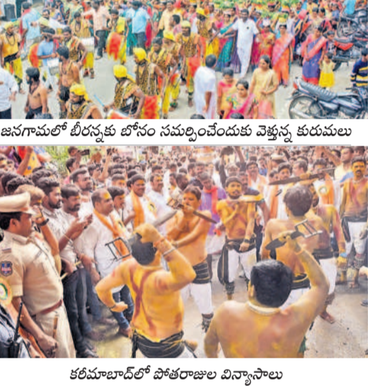
కరీమాబాద్లో పోతరాజుల విన్యాసాలు