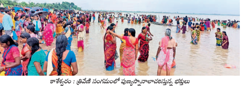
కాశ్యపరం : త్రివేణి సంగమంలో పుణ్యస్నానాలాచరిస్తున్న భక్తులు