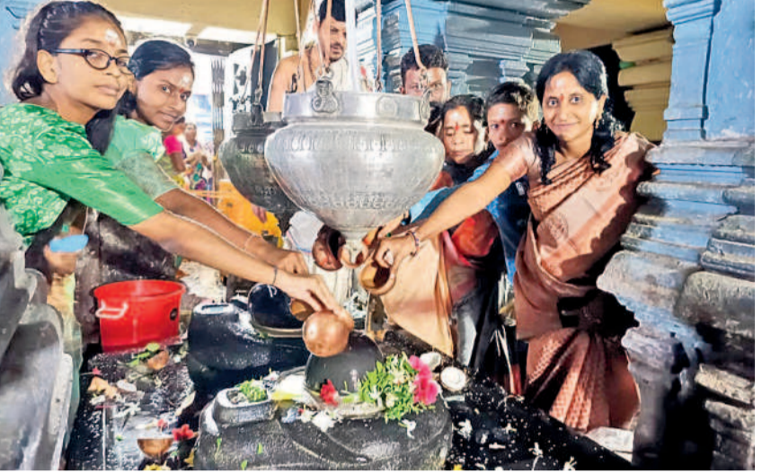
కాశ్యపరం : కాశ్యప, ముక్తికల్ అలయంలో పూజలు చేస్తున్న భక్తులు