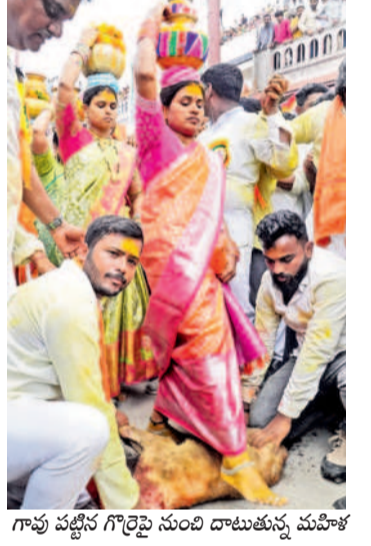
గాపు పట్టణ గొర్రెపై నుంచి దాటుతున్న మహిళ